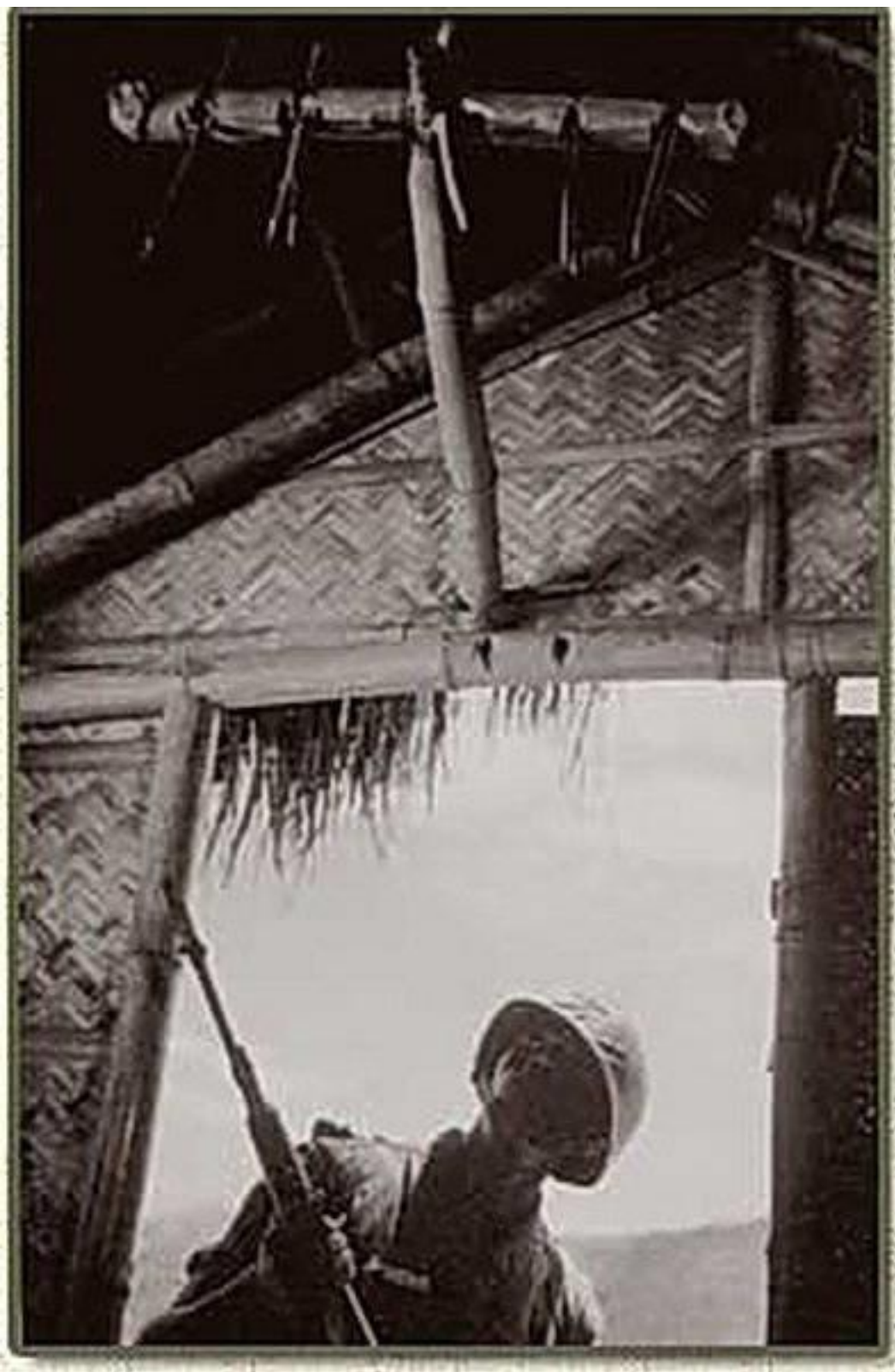
Приложение 4. Солдат из отряда «Туннельные крысы», вооруженный пистолетом Кольт 1911 и противогазом М-65.