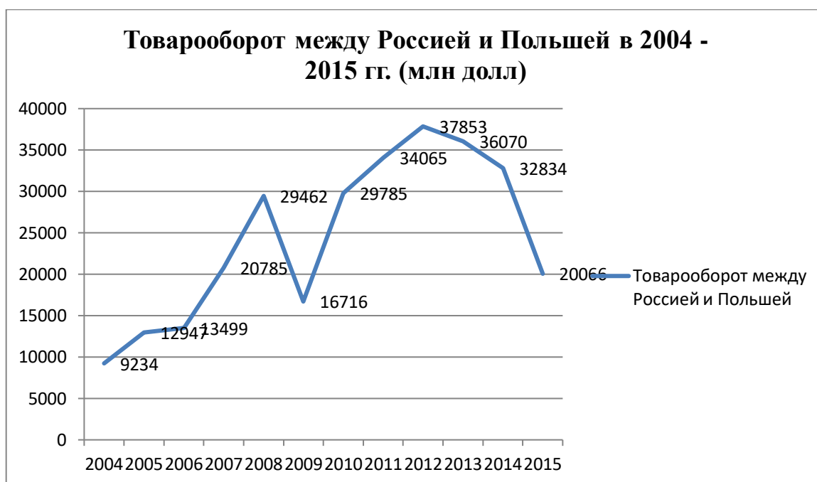
Рисунок 1 – тенденция товарооборота между Россией и Польшей в 2004 – 2015 гг. (млн долл)

Из рисунка 1 видно, что наиболее максимальных цифр товарооборот между двумя странами достигал в 2008 и в 2012 гг. После достижения максимальной отметки в 2012 г., товарооборот постепенно снижался и в 2015 г. составлял уже 20,1 млрд долл. Если говорить о причинах такой тенденции, то можно выделить несколько таковых: