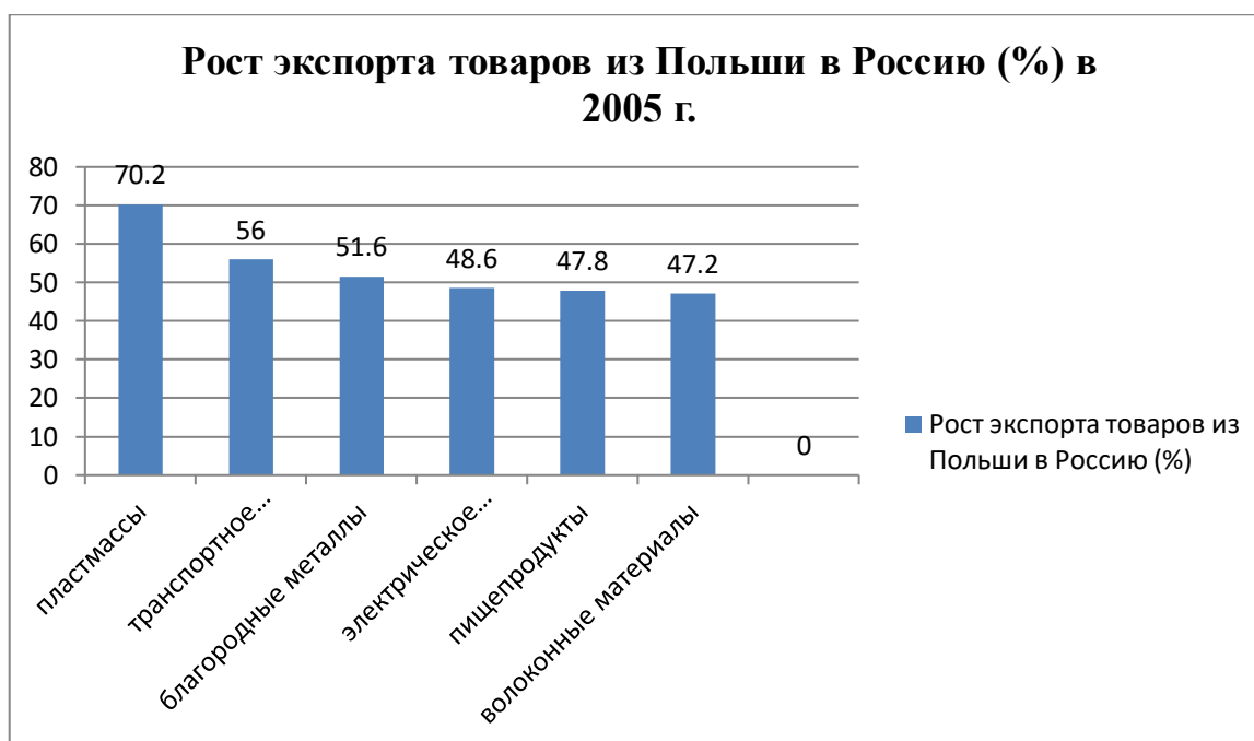
Рисунок – наивысшая динамика экспорта Польши в Россию по категориям товаров в 2005 г. (%)

В 2010 г. доля сельскохозяйственно-продовольственных товаров, по данным польской статистики, составила 15% и имела тенденцию к росту. В рамках данного товарооборота Польшей ввозится молочные продукты, мясо, сахар, живность, фрукты, овощи, кондитерские изделия и пр. В указанном году сельскохозяйственную продукцию для России выращивали и поставляли около 150 польских фирм. Приведем некоторые цифры: 2010 г. Польшей было ввезено в Россию 32 тыс. т мяса (говядины, свинины, птицы) 1 .