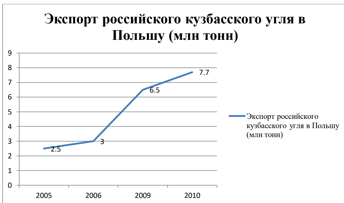
Рисунок 4 – Экспорт российского кузбасского угля в Польшу в 2005 – 2010 гг. (млн тонн)

Хотя в Польше давно говорилось об ослаблении энергетической зависимости Польши от России, но реальных шагов до прихода к власти Д. Туска не принималось. Так, президентом Туском в начале 2011 г. было начато строительство морского терминала по приему сжиженного природного газа в порту Свиноустье.