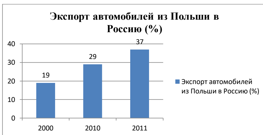
Рисунок 3 – Экспорт автомобилей из Польши в Россию в 2000, в 2010, 2011 г (%) 2 .

Если же говорить о структуре экспорта Польши в Россию, то ее состав значительно изменился в 2004 – 2006 гг. Так, с середины 2000-х годов на первом месте экспорта Польши в Россию находились автомобили, транспортные средства и оборудования, надо сказать что их доля повысилась на 10%, если в 2000 г. Составляла 19%, то в 2010 г. 29%, а в первой половине 2011 г. Повысилась еще на 8% и составила 37%, что наглядно отражено на рисунке 3.