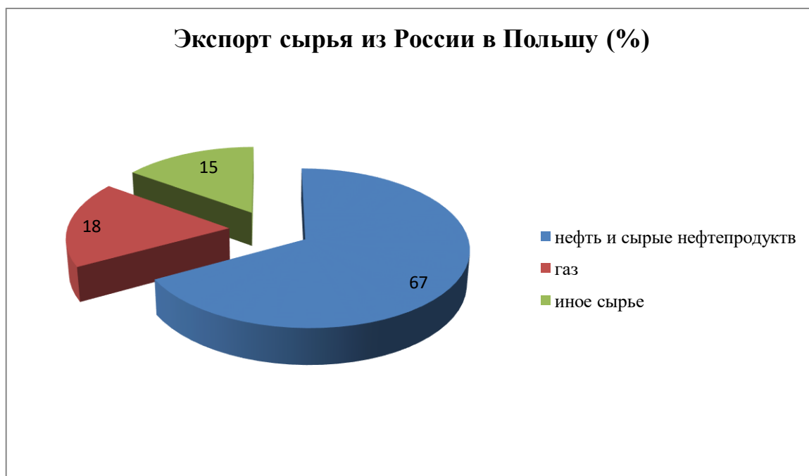
Рисунок 2 – доля нефти и газа в сырьевом экспорте России в Польшу 1 .

Необходимо сказать, что практически не изменилась структура экспорта в Польшу в 2000-х годах и по-прежнему носит сырьевой характер. Опираясь на данные Торгпредства РФ в Польше, отметим, что в 2010 г. доля нефти и сырых нефтепродуктов составила 67%, а газа – около 18%, в общей сложности эта сумма составляет 85%, что подробнее отражено на рисунке 2.