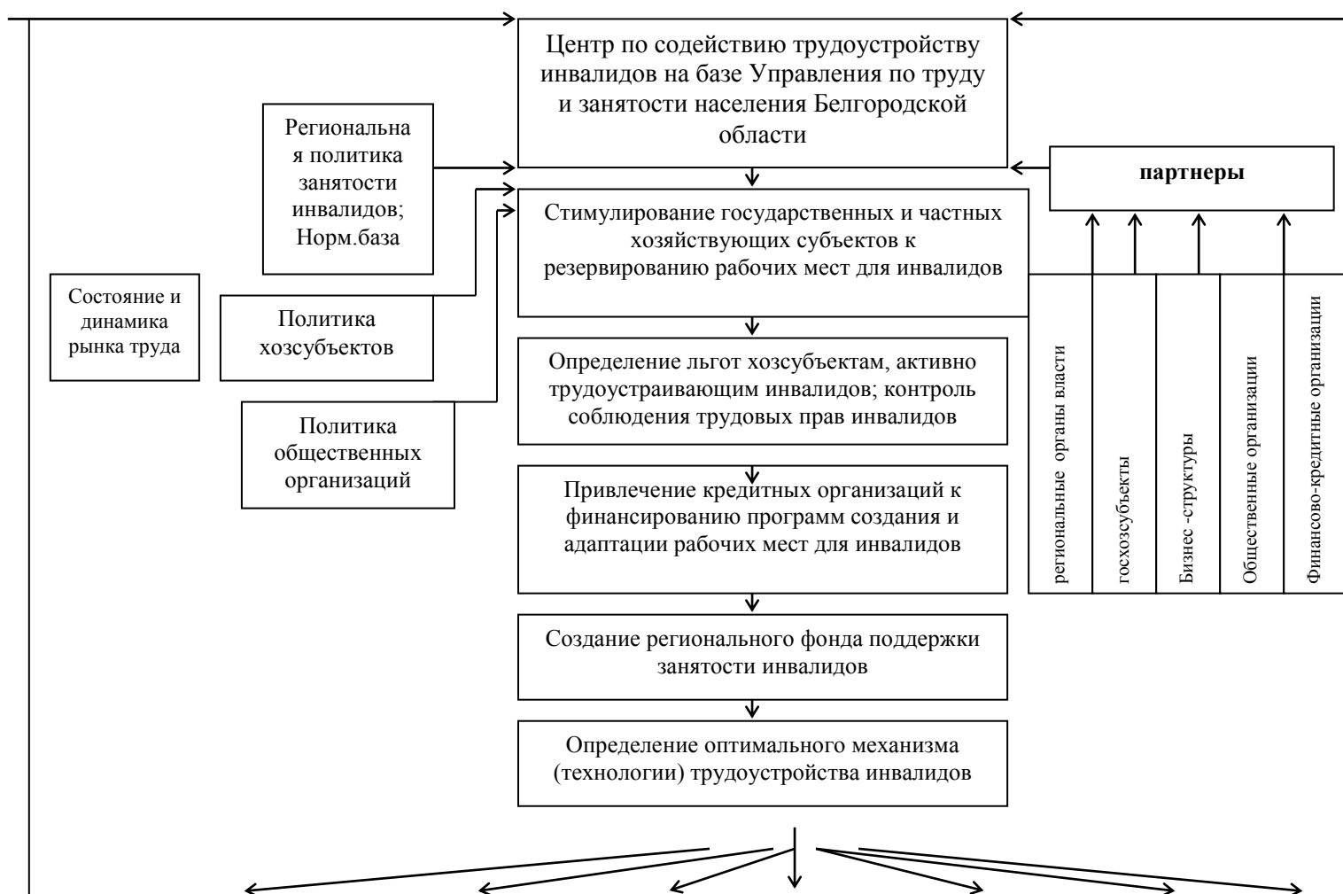
Рис.1 Модель межведомственного координационного Центра по содействию трудоустройству инвалидов

Модель Центра по содействию трудоустройству инвалидов может быть реализована при условии нормативно-правового, организационно - управленческого, информационно - аналитического, ресурсного обеспечения, проведения социологических исследований, подготовки кадров, научно - методического обеспечения, реализации целевых программ (рис.1).