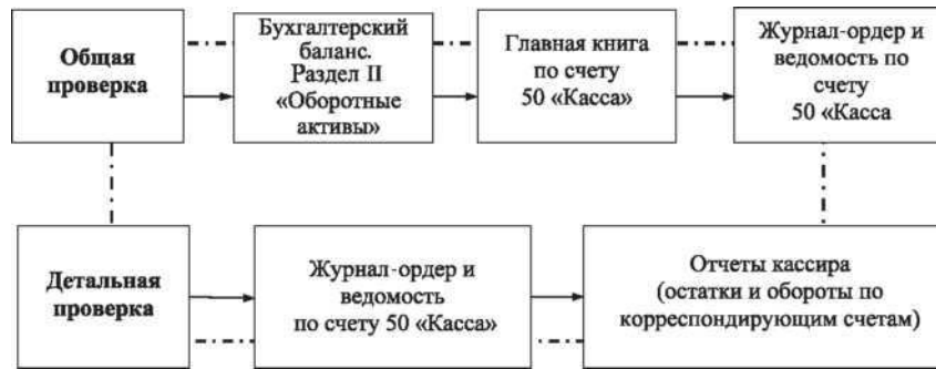
Рис.3.1. Методика общей и детальной проверки реальности сальдо по счету 50 «Касса»

Проведенный аудит состоял из аудит кассовых операций. В первой части аудиту были подвергнуты следующие документы: