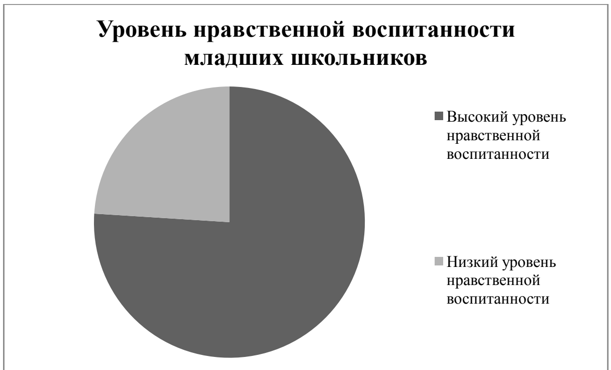
Рис. 2.3. Уровень нравственной воспитанности младших школьников.

По данным таблицы 2.12. можем сделать вывод, что соотношение высокого и низкого уровня нравственной воспитанности 3:1 (76,4% : 24,6%)