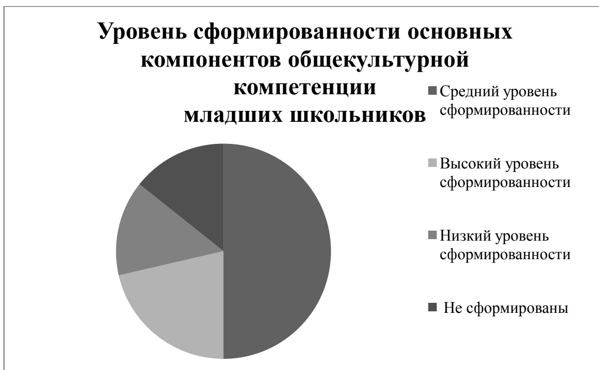
Рис. 2.1. Уровень сформированности основных компонентов общекультурной компетенции младших школьников

По данным таблицы 2.9. можем сделать вывод, что у 7 учащихся – средний уровень сформированности общекультурной компетенции (50%), у 3 учащихся – высокий (21,4%), у 2 учащихся – низкий (14,3%) и у 2 учащегося компетенция не сформирована (14,3%).