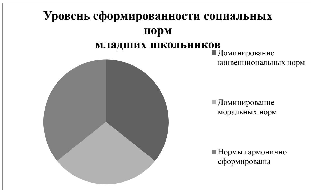
Рис. 2.2. Уровень сформированности социальных норм младших школьников.

На основе данных таблицы 2.11. представим диаграмму полученных результатов (рис. 2.2.).