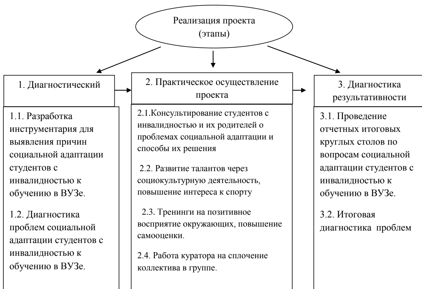
Рис. 2 «Этапы реализации проекта»

Проект предполагается реализовывать в три этапа: