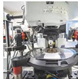
Школа биомедицины — одно из самых перспективных подразделений ДВФУ. Задача ученых — найти новые препараты, которые потенциально могут стать лекарствами (drug discovery)

ны на борьбе с раком центральной нервной системы. Глиальная (связана с нервной системой) опухоль считается самой агрессивной, ведь в течение пяти лет вероятность смерти больного составляет до 75%. Исследователи работают с реальными опухолями, полученными в ходе операций, которые проводятся в медцентре ДВФУ. После хирургического вмешательства часть пораженной плоти врачи передают в качестве образцов в Школу биомедицины. Примечательно, что транспортировка от хирургического стола до лаборатории занимает всего 10 минут. За это время клетки не успевают погибнуть: в лаборатории их жизнедеятельность поддерживают исследователи, снабжая образцы тканей питательными веществами.