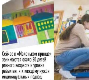
Сейчас в «Маленьком принце» занимаются около 20 детей разного возраста и уровня развития, и к каждому нужен индивидуальный подход