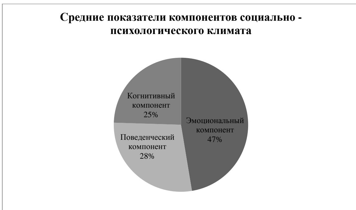
Рисунок 1 – Средние значения показателей компонентов социально - психологического климата

В результате исследования социально - психологического климата в данной выборке и анализа полученных данных были выявлены средние показатели компонентов социально – психологического климата, которые представлены на рисунке 1.