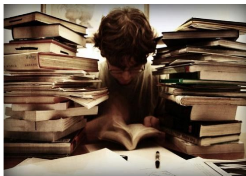
Иллюстрация , предназначенная для визуализации содержания темы и стимулирования к обсуждению темы, способствует развитию ассоциативного мышления и эмотивной сферы общения. Кроме того, иллюстрация должна вызвать интерес обучающихся к изучаемой теме.

Основная часть. Второй блок урока – просмотр видеосжета 1. В этом блоке предусмотрены: показ видеофрагмента (2 раза); иллюстрация (стоп-кадр, где представлены участники диалога); презентация разговорных конструкций с