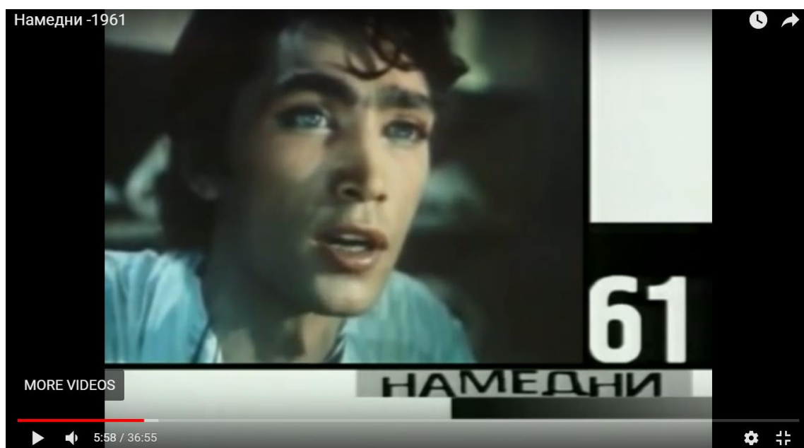
Рис.4 – Кадр из передачи «Намедни» 1961 года