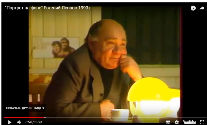
Рис.1 – Кадр из передачи «Портрет на фоне» с Евгением Леоновым, 1993 год