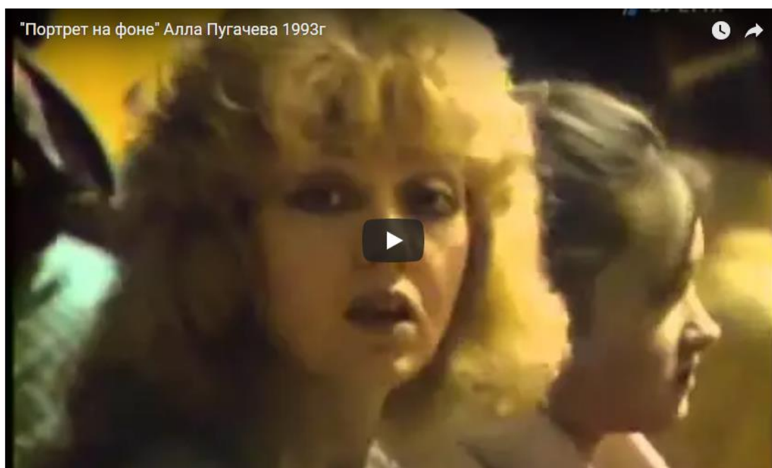
Рис.2. – Кадр из передачи «Портрет на фоне» с Аллой Пугачевой