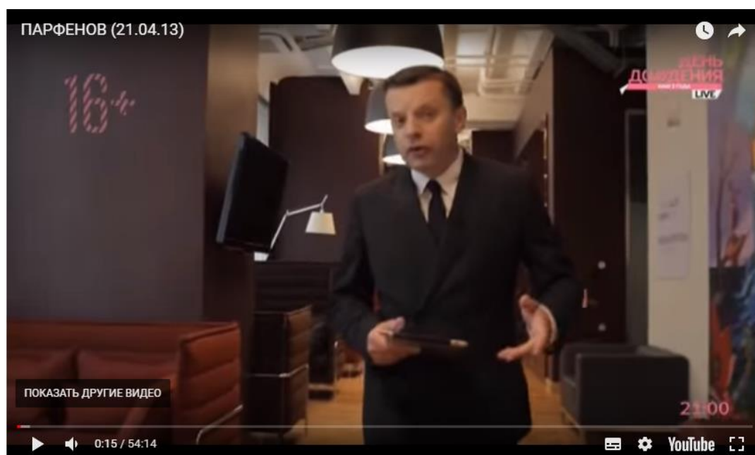
Рис.6 – Кадр из передачи «Парфенов»