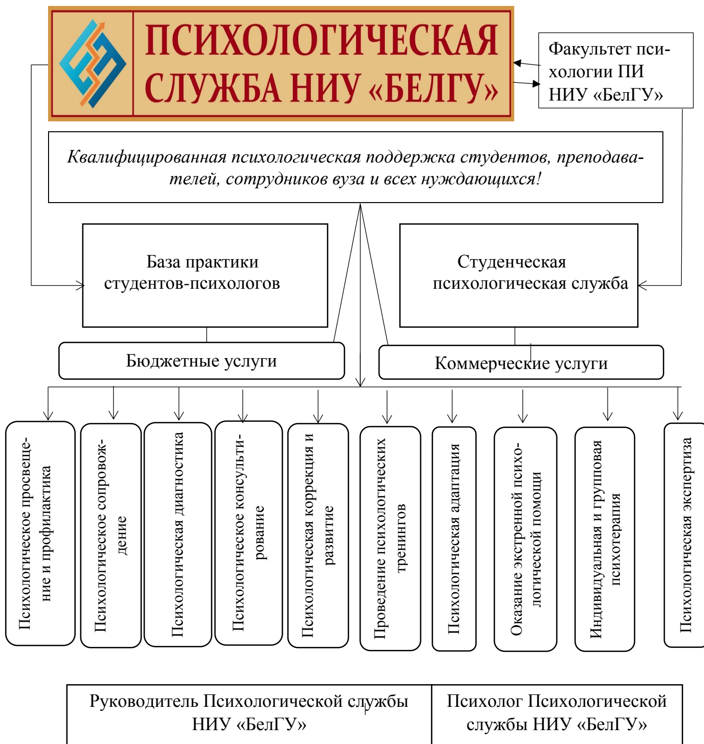
Рис. 2.1.2. Структурная модель Психологической службы НИУ «БелГУ»