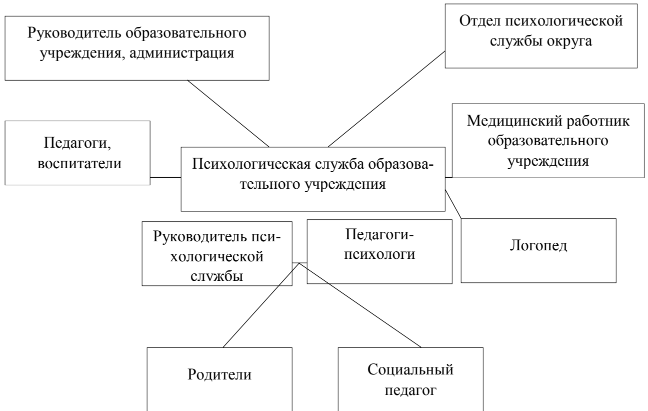
Рис. 1.3.1. Первичное звено психологической службы города

Изотова Е.И. также говорила о модели профессиональной деятельности психолога образовательного учреждения, которая, по её мнению, является фундаментальным звеном в структуре психологической службы вуза [13, с.57]. В зависимости от приоритетного направления деятельности, она выделила 5 моделей, выбор которых зависит от: 1) профессиональной позиции и компетентности самого психолога; 2) политики образовательного учреждения (устав, корпоративная культура, миссия учреждения, характер запросов).