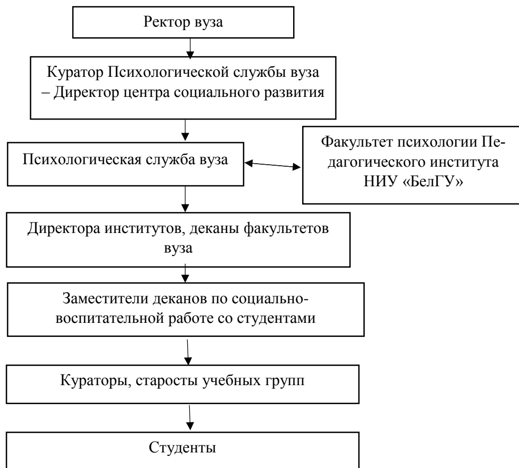
Рис. 2.1.1. Положение Психологической службы в структуре НИУ «БелГУ»

рим положение Психологической службы в структуре НИУ «БелГУ» (Рис. 2.1.1).