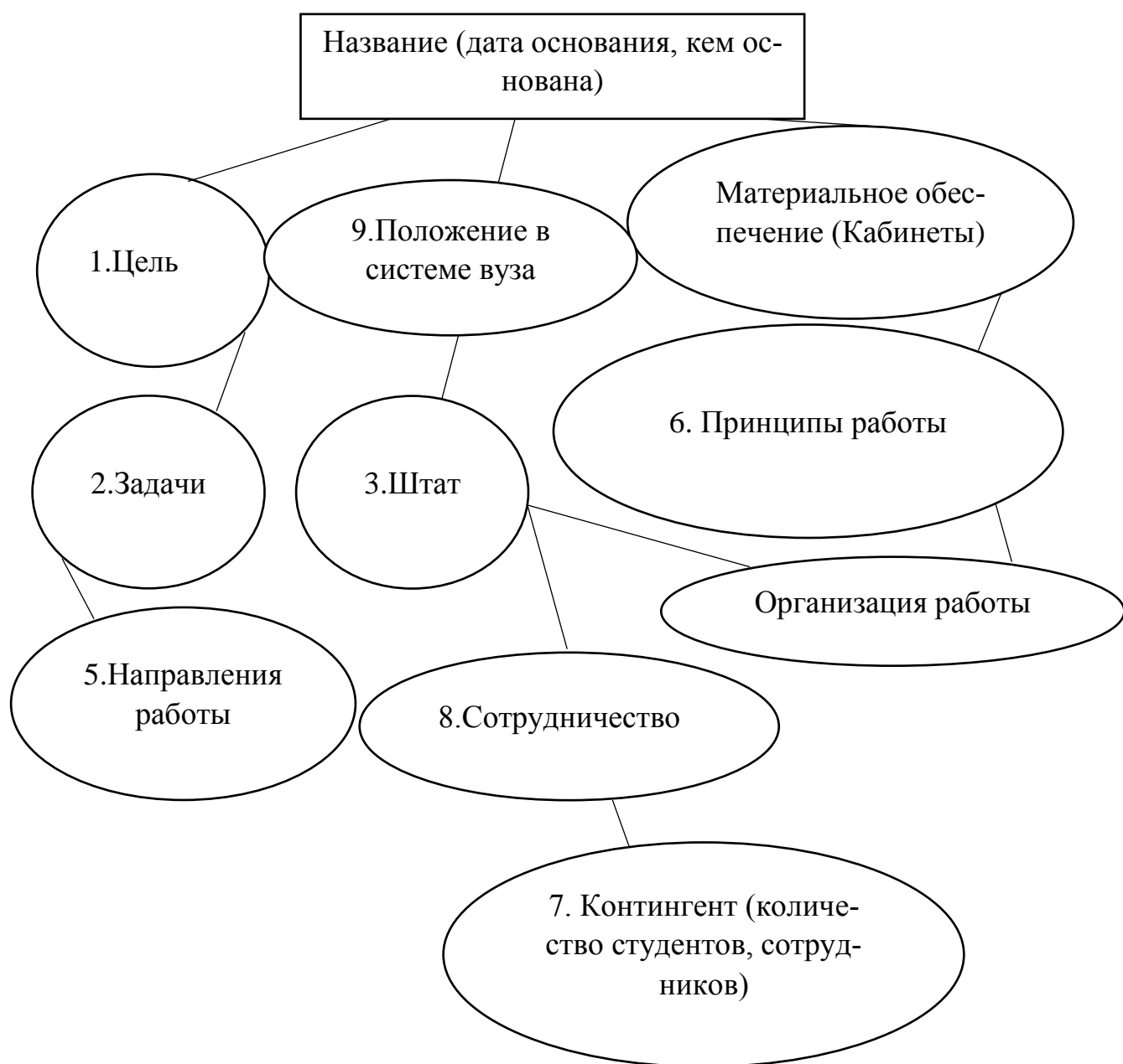
Рис. 1.3.2. Компоненты модели Психологической службы вуза

Обобщая все существующие современные модели Психологических служб можно выделить следующие компоненты для составления модели Психологической службы НИУ «БелГУ» (Рис.1.3.2).