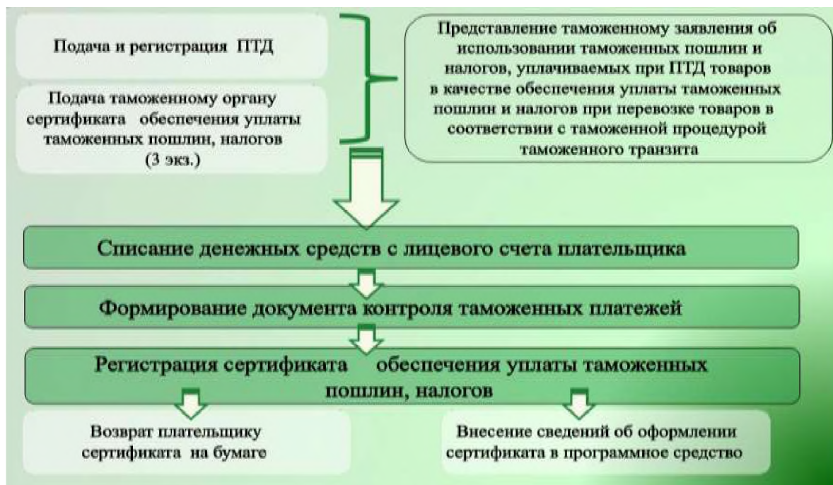
Рис. 3. Технология использования обеспечения таможенного транзита при предварительном декларировании товаров

Белгородская таможня была подключена к эксперименту по электронному взаимодействию с участниками ВЭД при помещении товаров под процедуру таможенного транзита с мая прошлого года. Сегодня результаты совместной работы таможни и участников ВЭД уже вполне ощутимо свидетельствуют о положительной динамике. С начала 2017 года доля электронных транзитных деклараций составила 39,5 % от общего количества.