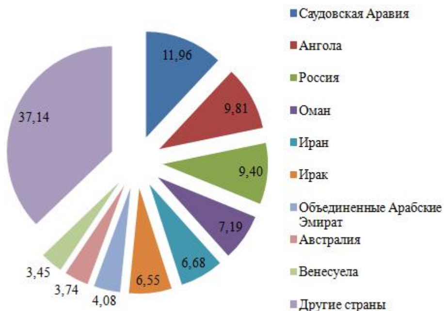
Рис. 3.1. Минеральное топливо, масла, продукты перегонки, и прочие виды топлива и нефтепродуктов