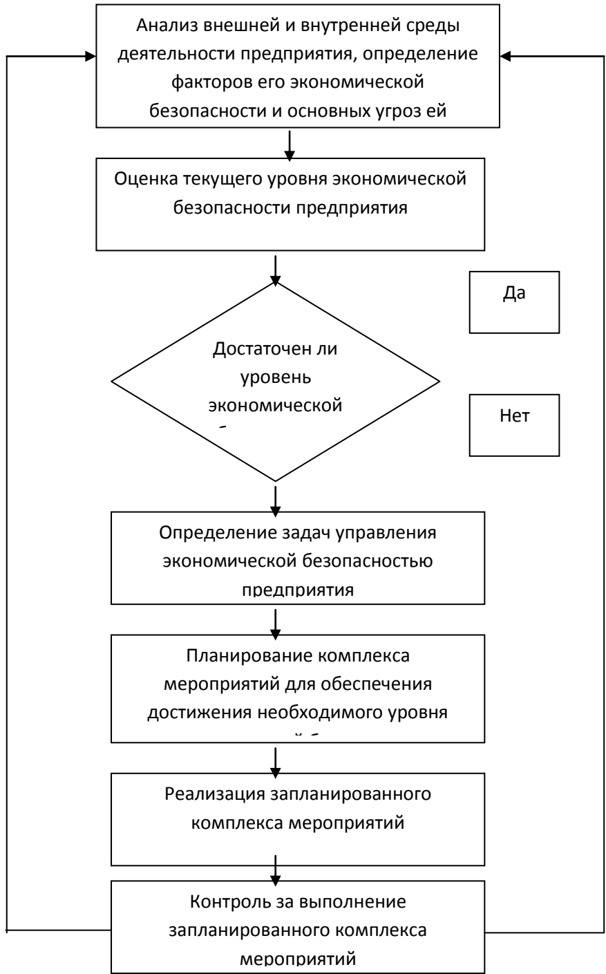
Рис. 3.1. Процесс управления экономической безопасностью предприятия АО «Белгородский хладокомбинат»

Непрерывный процесс управления экономической безопасностью предприятия АО «Белгородский хладокомбинат» в упрощенном виде, можно изобразить следующим образом на рис. 3.1.