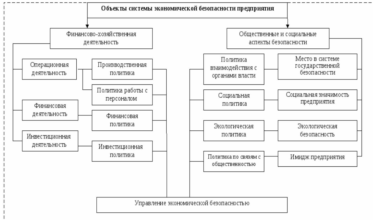
Рис. 2.2. Схема управления экономической безопасностью предприятия АО «Белгородский хладокомбинат»