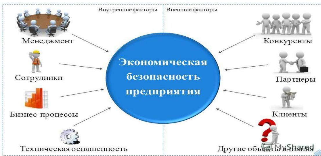
Рис. 2.1. Факторы, влияющие на экономическую безопасность предприятия

Экономическая безопасность предприятия зависит от целого ряда факторов, которые наглядно представлены на рис. 2.1.