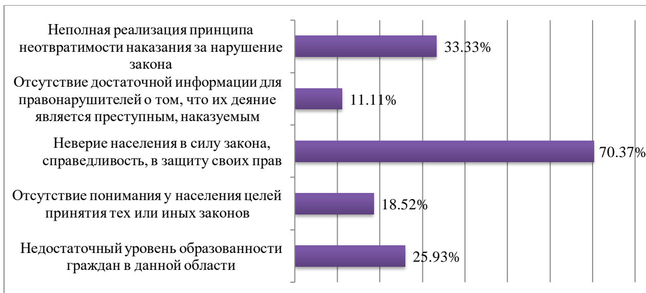
Рис. 2. Распределение ответов на вопрос: «С чем связаны причины неуважительного отношения граждан к нормам закона?»

По мнению экспертов, распространенность правовых навыков среди населения области, т.е. умение строить свое поведение на основе правовых знаний и в соответствии с требованиями закона, находится на среднем уровне (59,26%). Треть экспертов (33,33%) утверждают, что распространенность правовых навыков находится на низком уровне, и лишь 7,41% отметили высокий. При этом отмечаются следующие положительные тенденции: