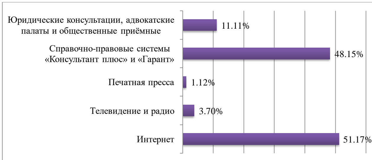
Рис. 5. Распределение ответов на вопрос: «Какой источник правовой информации Вы считаете наиболее удобным?»

Ответы экспертов на вопрос о наиболее удобных источниках правовой информации представлены на рисунке 5.