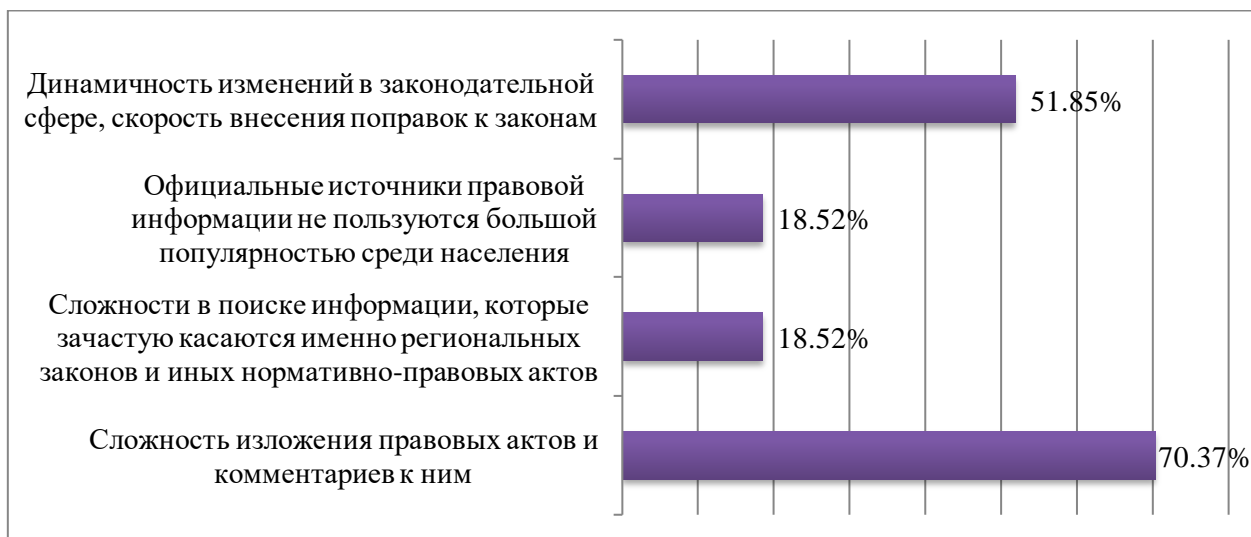
Рис. 4. Распределение ответов на вопрос: «Какие ограничения, связанные с получением правовой информации простыми гражданами, по Вашему мнению, преобладают?»

Однако экспертным сообществом отмечается ряд ограничений, связанных с получением информации простыми гражданами (рисунок 4).