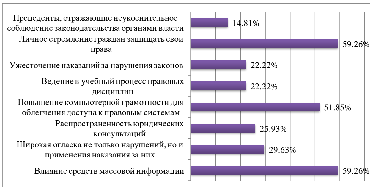
Рис. 1. Распределение ответов на вопрос: «Какие из нижеперечисленных факторов, по Вашему мнению, оказывают наиболее сильное воздействие на повышение уровня правовой грамотности населения?»

В числе главных факторов, оказывающих наиболее сильное воздействие на повышение уровня правовой грамотности населения, эксперты выделили влияние средств массовой информации, личное стремление граждан защищать свои права, повышение компьютерной грамотности для облегчения доступа к правовым системам, распространенность юридических консультаций (рисунок 1).