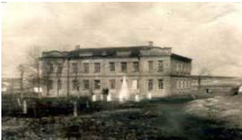
Безымянный обелиск погибшим воинам, с.Нагольное