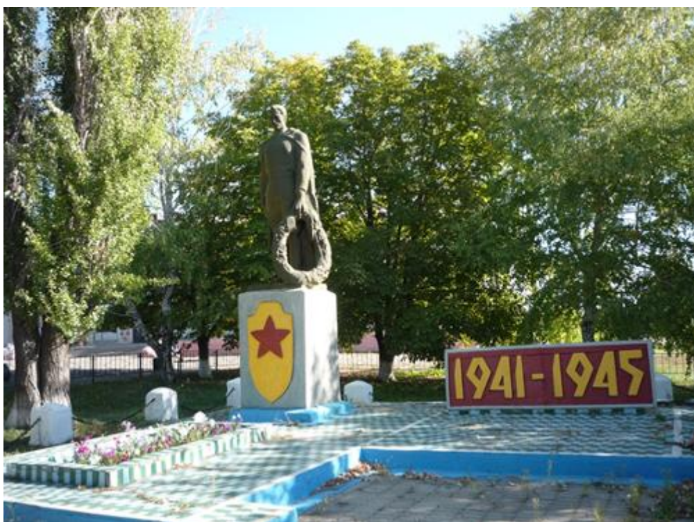
Памятник погибшим воинам, с. Харьковское