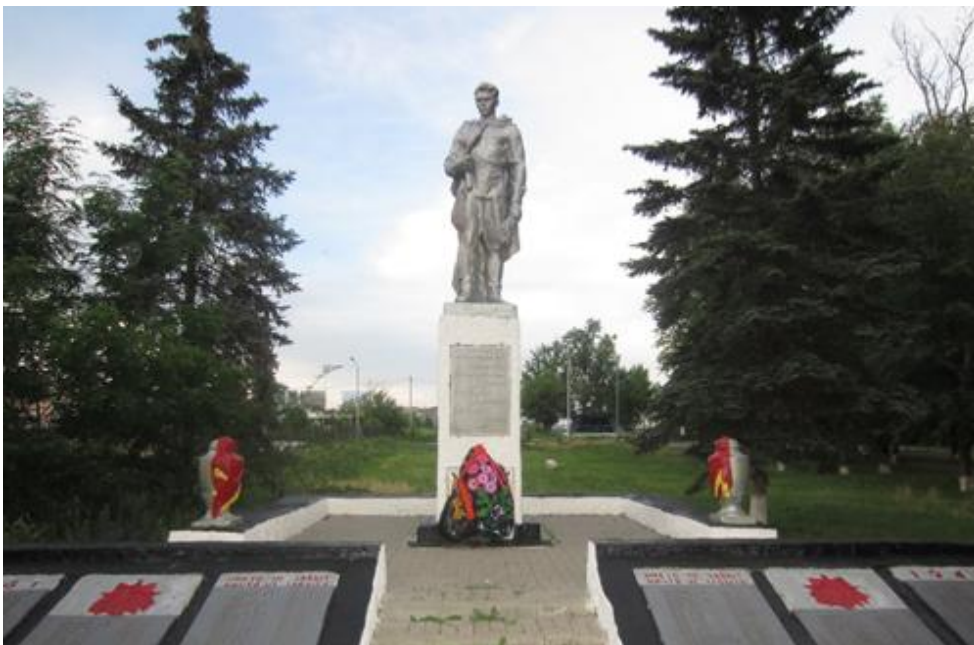
Памятник погибшим воинам, с.Новоалександровка