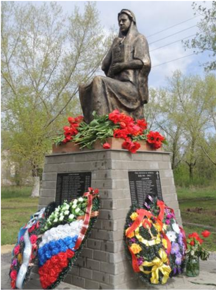
Памятник воинам-землякам, погибшим в годы войны х. Лихолобово Ровеньского района