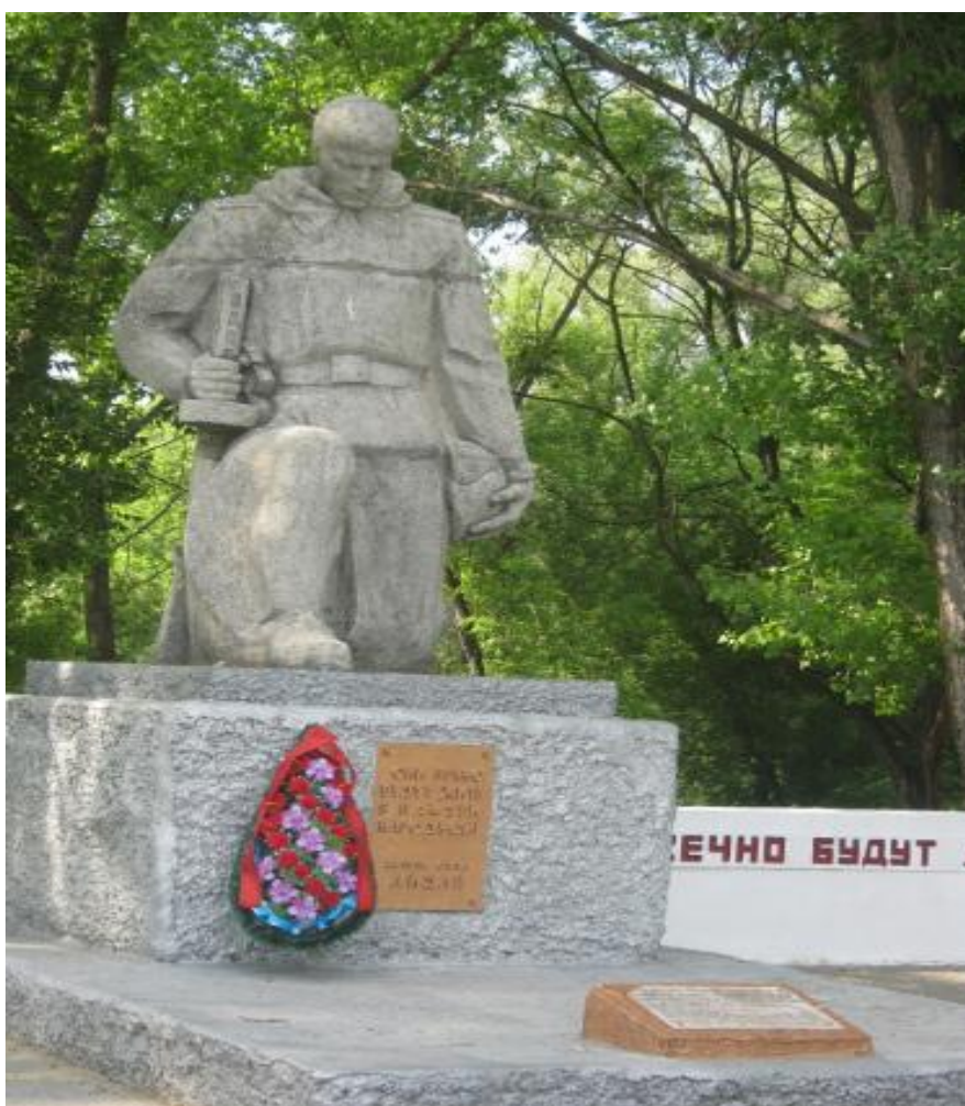
Памятник погибшим воинам, с. Айдар