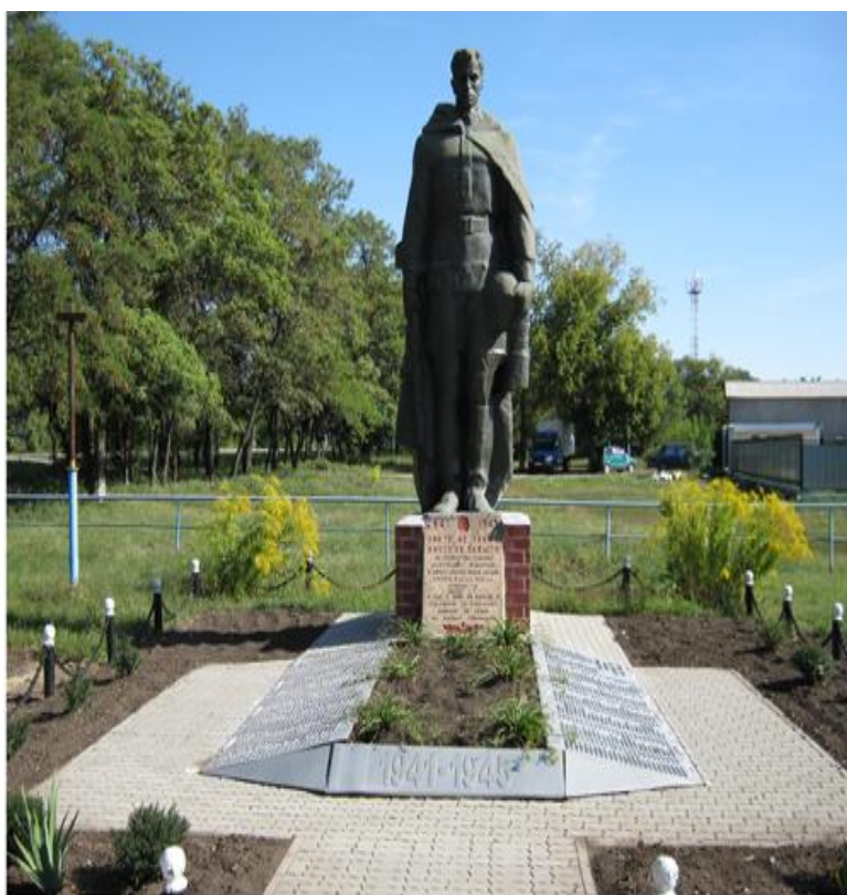
Памятник погибшим воинам, с. Нагорье