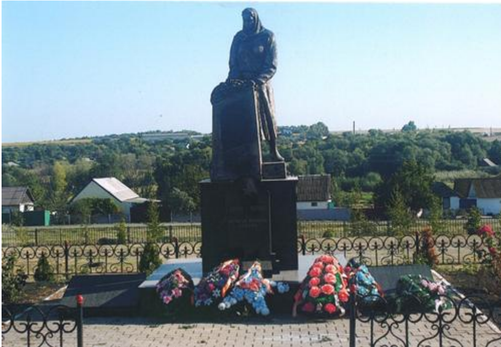
Памятник погибшим воинам, с. Ржевка