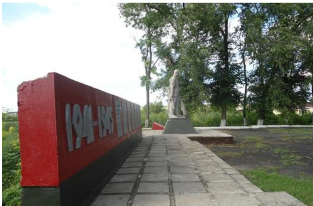
Памятник погибшим воинам, п. Ровеньки