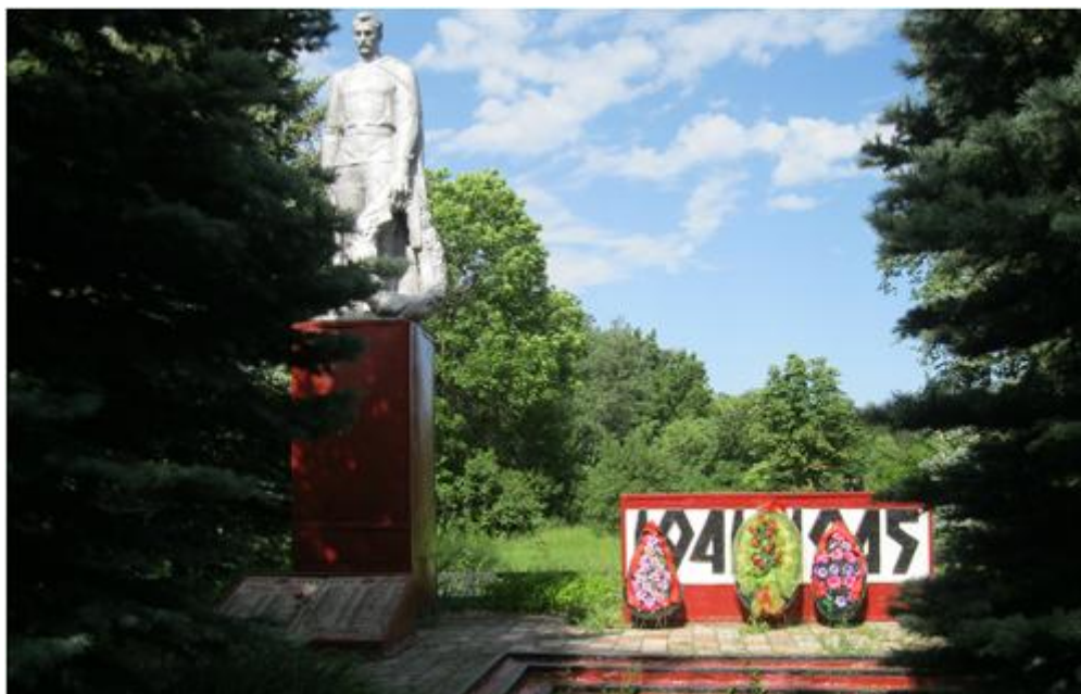
Памятник погибшим воинам, с. Лозовое