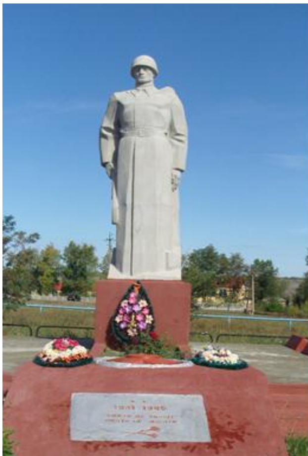
Памятник погибшим воинам, с. Клименково