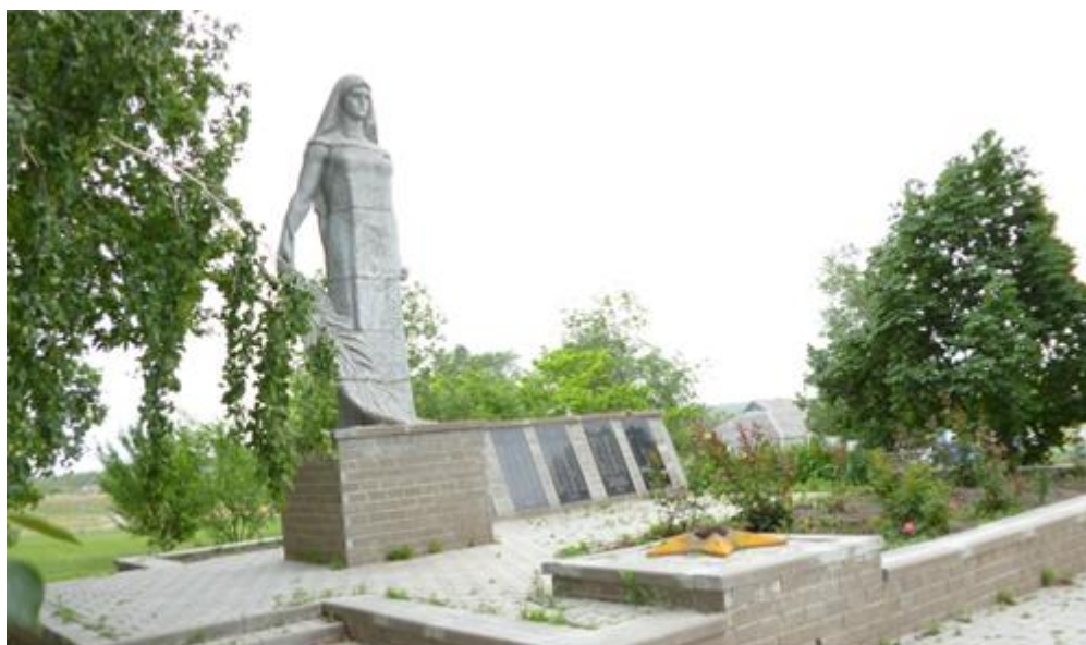
Памятник погибшим воинам, с. Верхняя Серебрянка