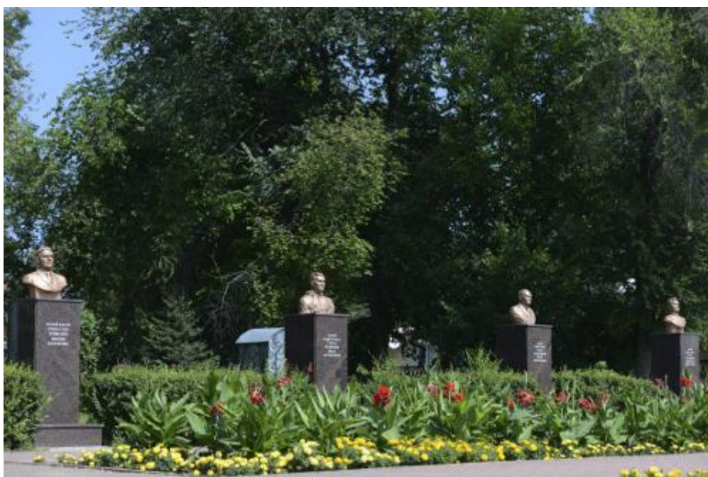
АЛЛЕЯ СЛАВЫ ГЕРОЕВ, п. Ровеньки