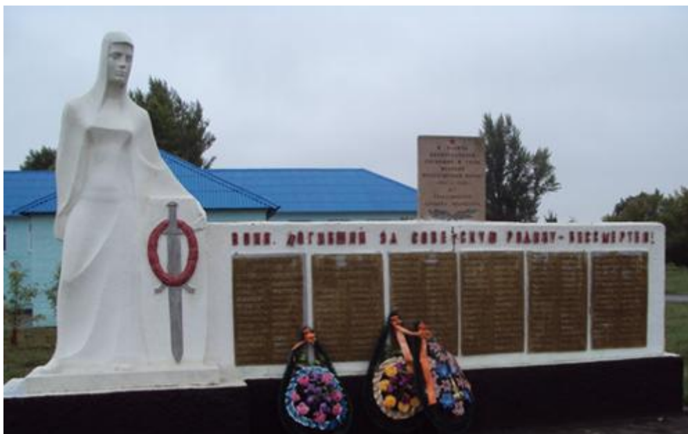
Памятник погибшим воинам, с. Лозня