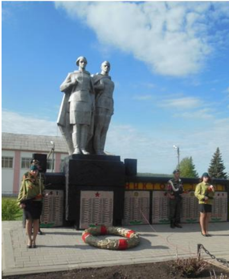
Памятник погибшим воинам, с. Свистовка