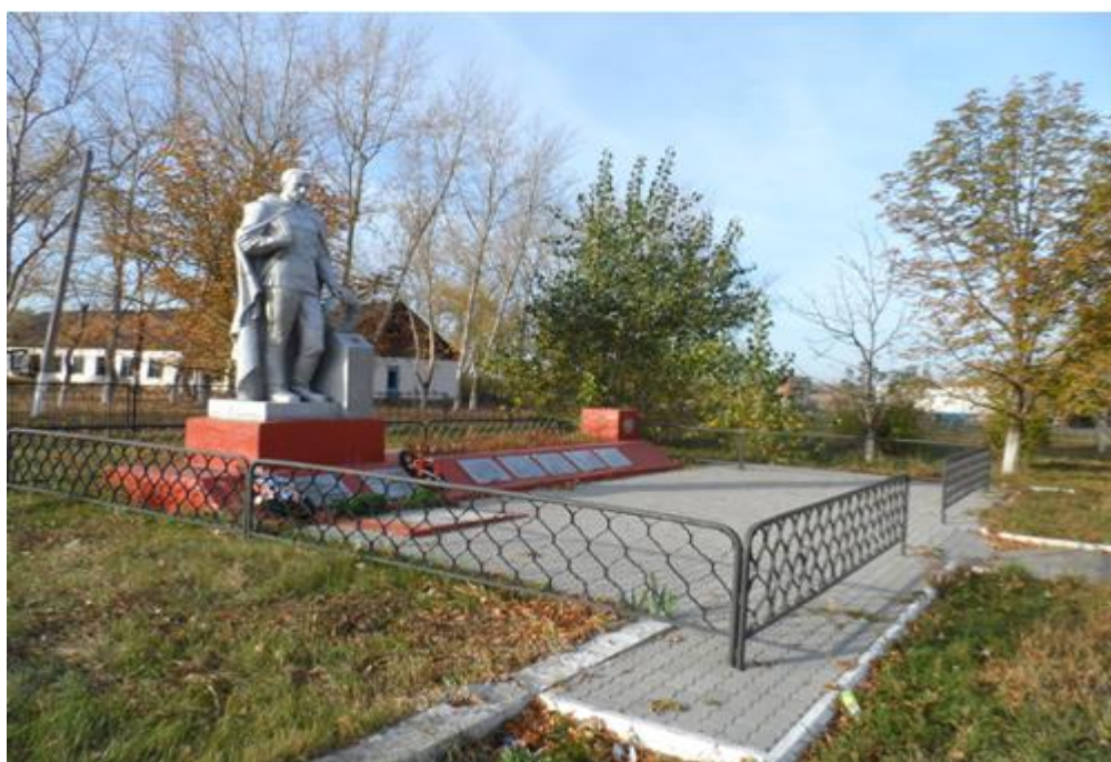
Памятник погибшим воинам, с. Жабское