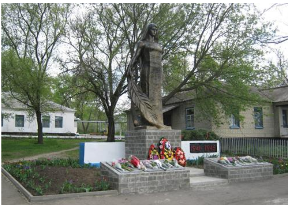
Памятник погибшим воинам, с. Пристень