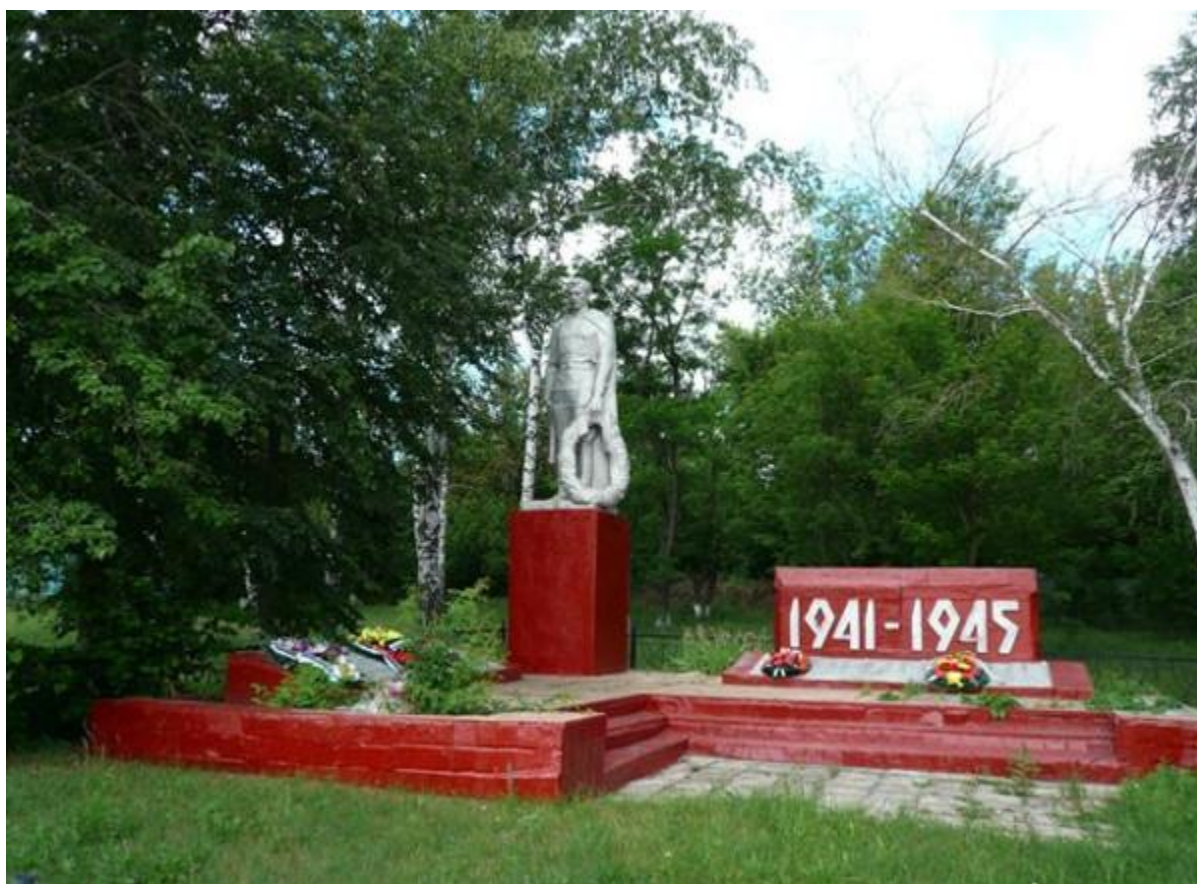
Памятник погибшим воинам, с. Ладомировка