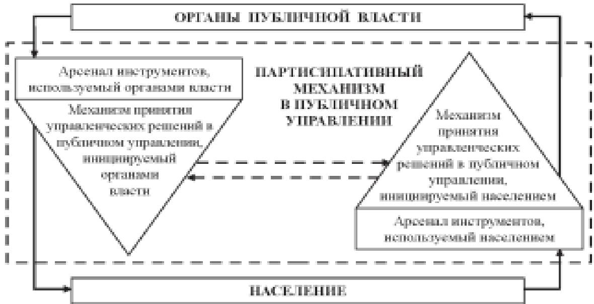
Рис. 5. Структура партисипативного механизма в публичном управлении

Механизм принятия решений в публичном управлении, инициируемый органами публичной власти, имеет вектор направленности взаимодействия «сверху – вниз» и использует в качестве партисипативных инструментов следующие: «защиту интересов», «информирование», «встречу с населением» (в т. ч. обмен информацией), «выявление общественного мнения», «консультации», «сотрудничество». Механизм принятия решений в публичном управлении, инициируемый населением, выражается вектором направленности взаимодействия «снизу – вверх» и применяет такие партисипативные инструменты, как «обращения», «экспертная (общественная) оценка», «гражданская инициатива», «участие в деятельности органов публичной власти».