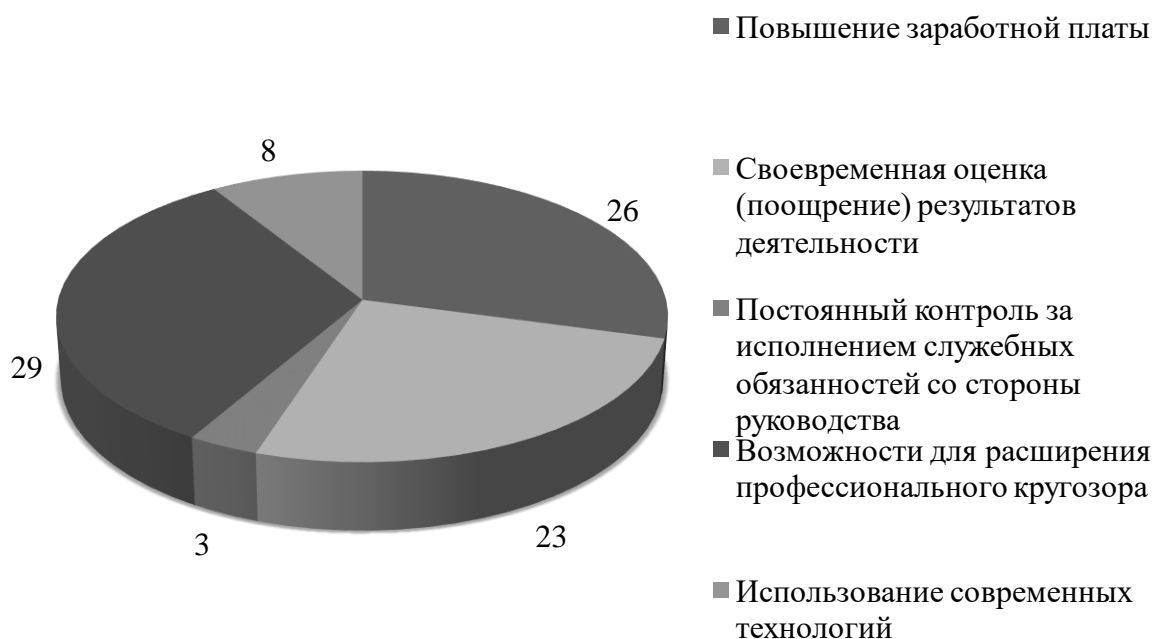
Рис. 1. Факторы необходимые для повышения эффективности работы респондентов, %

При оценке специальных профессиональных знаний и навыков ответы респондентов были не так однозначны. Так, наличие знаний о путях развития общества и государства, восприятие ситуаций и решение задач с позиции государственных приоритетов в большей или меньшей степени отметили 56% государственных служащих; умение гибко адаптировать тактику своих действий и действовать в соответствии с конкретной ситуацией или особенностями поведения того или иного человека характерно для 62%; готовность нести ответственность за собственные решения отмечают 67% респондентов; постоянное профессионально-квалификационное развитие (59%); способность предлагать новаторские решения (48%); знание структуры общественных институтов, особенностей построения системы государственного и муниципального управления (71%); умение правильно оформлять типовые документы, знание процедур их согласования, утверждения, хранения и перемещения (74%); умение выполнять отдельные функции в проекте (63%); навыки подготовки презентаций, использования графических объектов в электронных документах (82%).