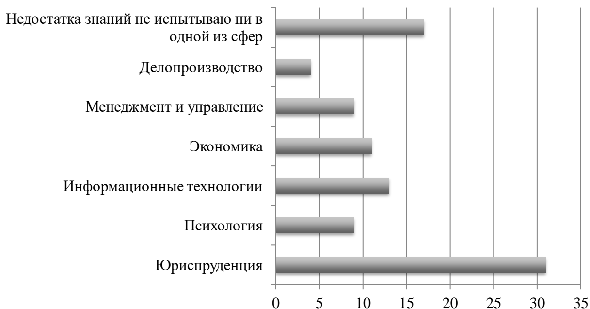
Рис. 2. Распределение ответов респондентов на вопрос о том, в какой сфере они испытывают недостаток знаний, %

В качестве факторов, влияющих на развитие инвестиционного потенциала в среднесрочной перспективе 80% респондентов отнесли политическую, социальную и экономическую стабильность. Кроме того, 25% государственных служащих в качестве важного фактора выделили создание высокоэффективного производства и инновационной продукции.