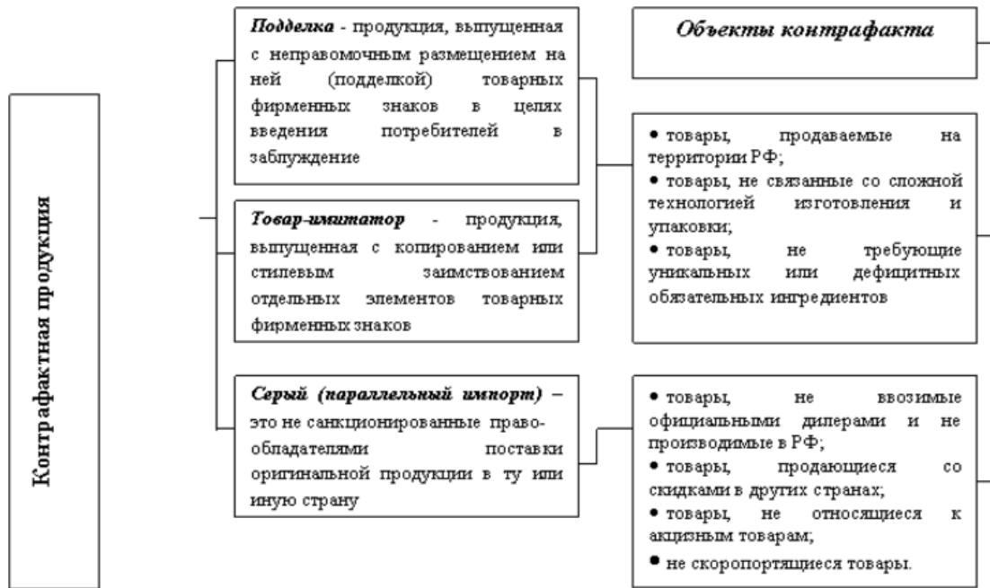
Рисунок 1. Классификация контрафактной продукции

Подделки чаще поражают рынки повседневных, массовых товаров, где легко затеряться среди изобилия продуктов и множества компаний. Подделывают тот продукт, который уже завоевал рынок и имеет высокую лояльность потребителей. Самые известные бренды содержат наибольший соблазн для контрафактного дублирования.