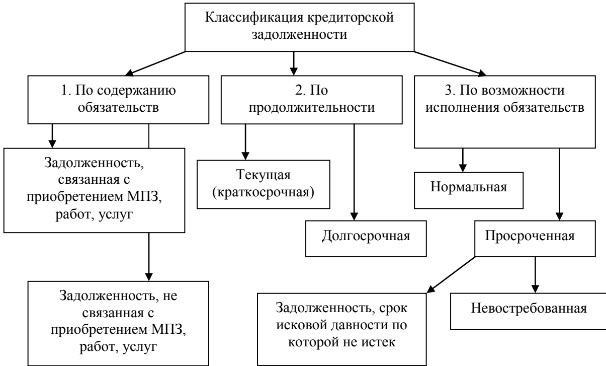
Рис. 1.2. Классификация кредиторской задолженности

Как было указано на рисунке, по содержанию обязательств, кредиторская задолженность может быть связана с приобретением МПЗ (материально-производственных запасов), работ и услуг, (за приобретенную продукцию, услуги и товары, а также за предъявленные к оплате векселя) и не связана с ней (задолженность по расчетам с бюджетом, задолженность перед дочерними и зависимыми обществами, перед персоналом организации, перед участниками (учредителями) по выплате доходов, прочая задолженность).