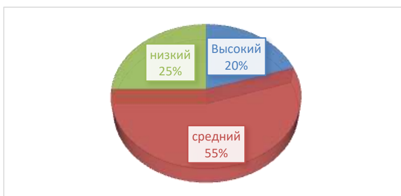
Рис 2.2. Результаты диагностики сформированности аффективного (эмоционального) компонента у детей старшего дошкольного возраста

Обобщив результаты диагностики детей, мы видим, уровень сформированности аффективного (эмоционального) компонента у старших дошкольников: у 20% (4 детей) выявлен высокий уровень; у 55% (11 детей) средний уровень и у 25% (5 детей) обнаружен низкий уровень аффективного (эмоционального) компонента (рис 2.2).