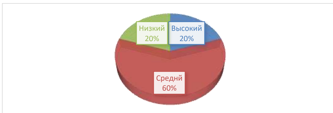
Рис.2.4. Результаты диагностики уровня сформированности культуры общения у детей старшего дошкольного возраста

Результаты констатирующего эксперимента мы представили в сводной таблице 2.4(Приложение 2) и на рис. 2.4