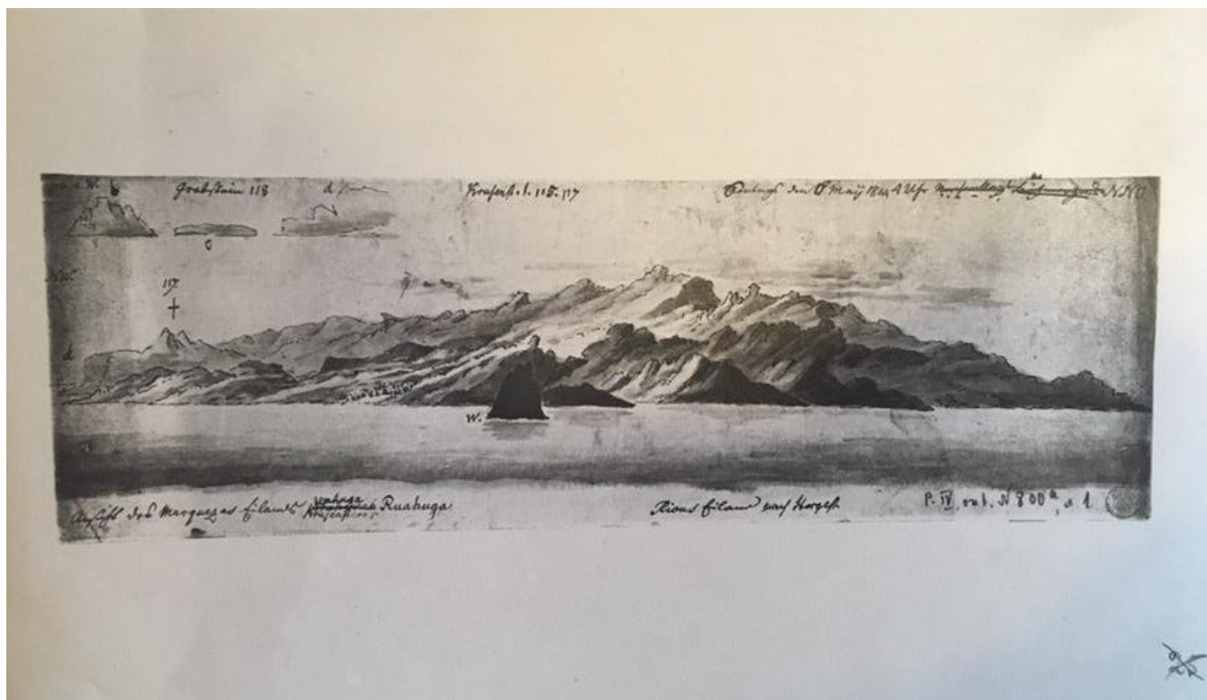
Рисунок не атрибутирован (Предположительно один из островов Вест-Индии) 178