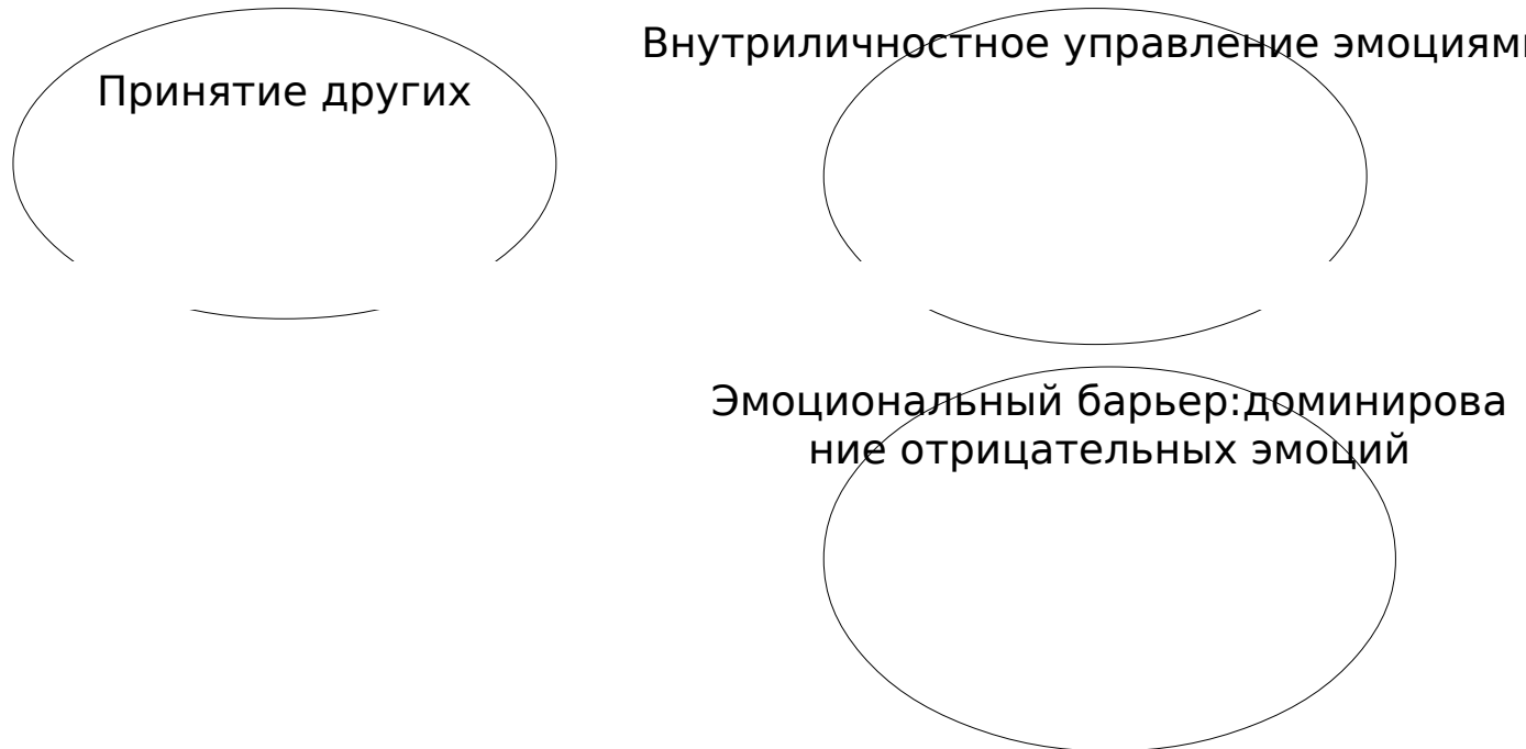
Рис. 1 . Графическое изображение взаимосвязей между показателями социальной перцепции и эмоционального интеллекта у студентов-педагогов факультета психологии