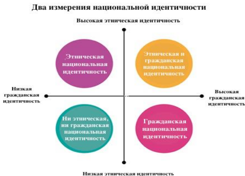
Рисунок 1 – Два измерения национальной идентичности

составляющие. Применительно к Канаде речь скорее идет и об этнической, и о гражданской национальной идентичности, так как упор делается и на особенности развития общества, и на разнообразие этнического состава канадского населения. (См. Рисунок 1).