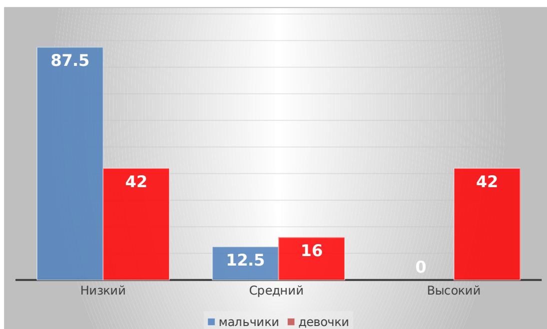
Рис. 2.5. Показатели уровня этнической толерантности у мальчиков и девочек (в %)