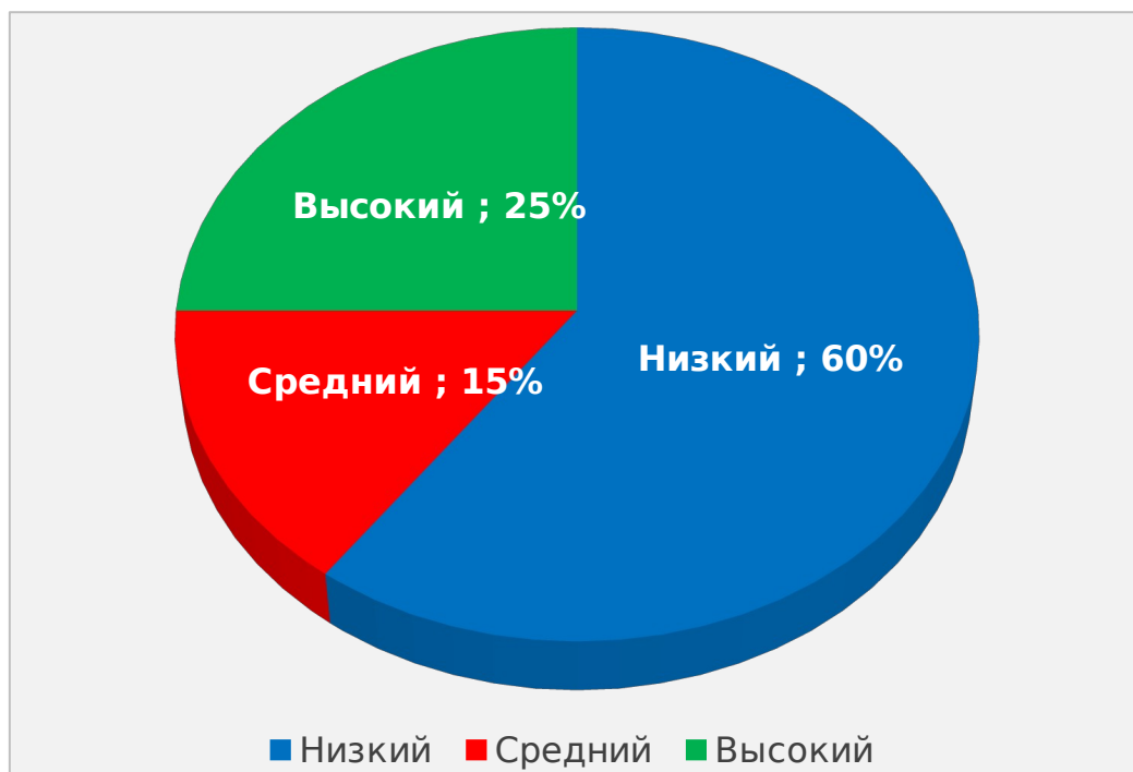
Рис 2.4. Показатели уровня этнической толерантности у подростков (в %)