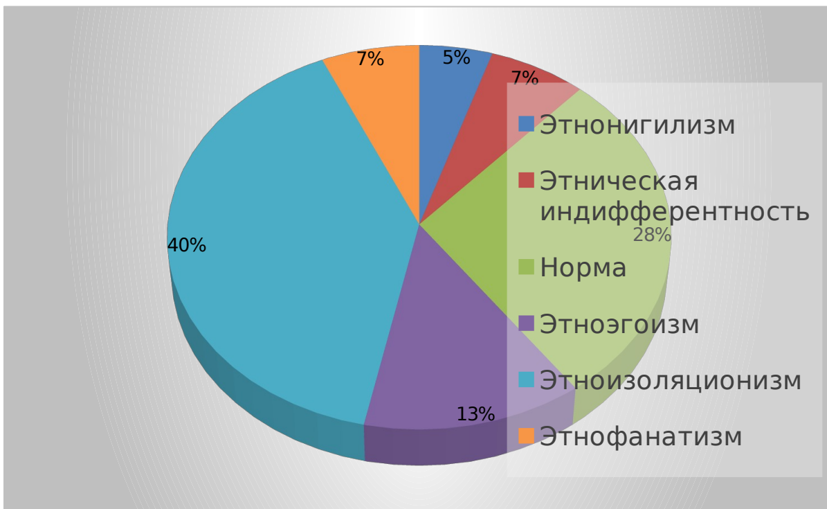
Рис. 2.2. Типы проявления этнической идентичности у подростков (в %)