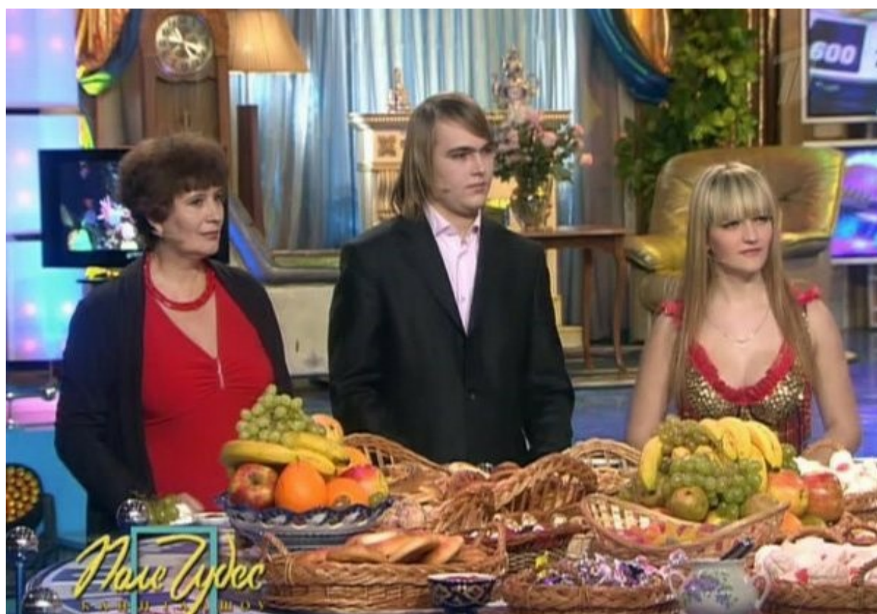
Тройки участников в разные годы

Ведущих за всю историю программы было всего двое. Сам Листьев считал Якубовича очень хорошей заменой: "Он не пытается меня копировать, хотя в чем-то безусловно повторяется. Наверное, он более вписывается в игру, чем я". В сентябре-октябре 1991 года был организован конкурс на почтенное место, польстившиеся на него простые люди из народа провели по одному выпуску. Якубович утверждает, что в отборе ведущих не участвовал, отказался с самого начала,