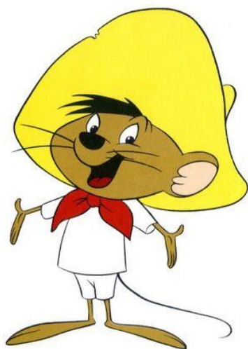
Рис. 2. Спи́ди Гонсалес