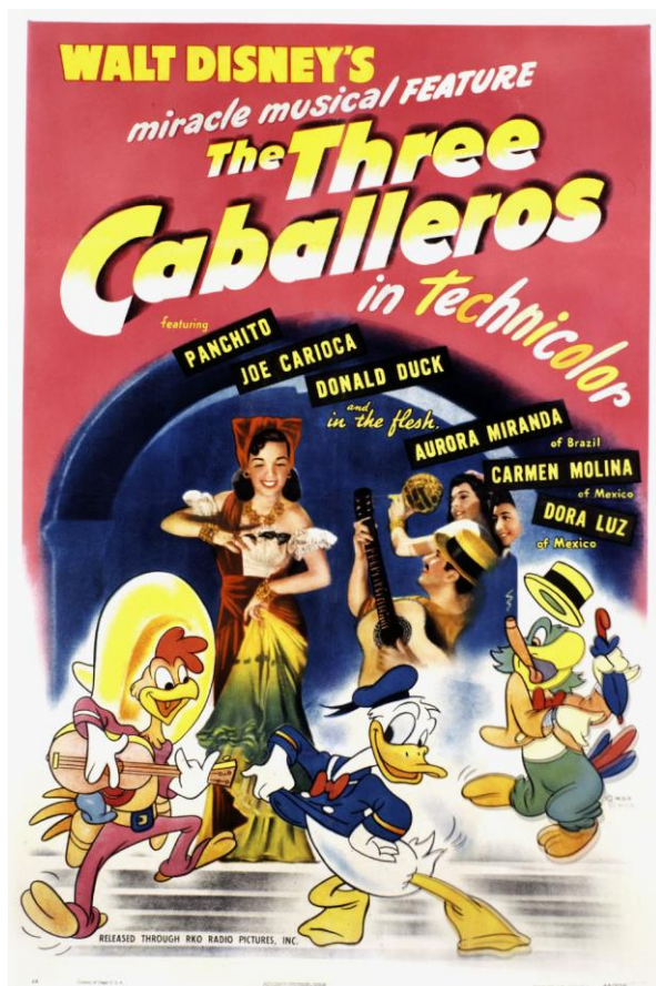
Рис.1. Афиша к мультфильму The Three Caballeros / Три кабальеро (1945, реж. Н. Фергюсон, К. Дженероми, Д. Кинни, Б. Робертс и Х. Янг)