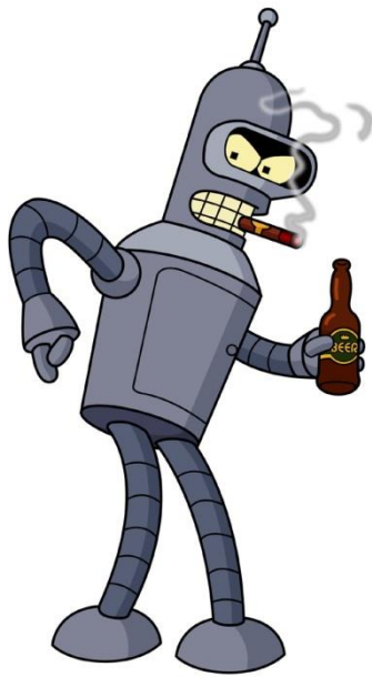
Рис.3. Робот Бендер