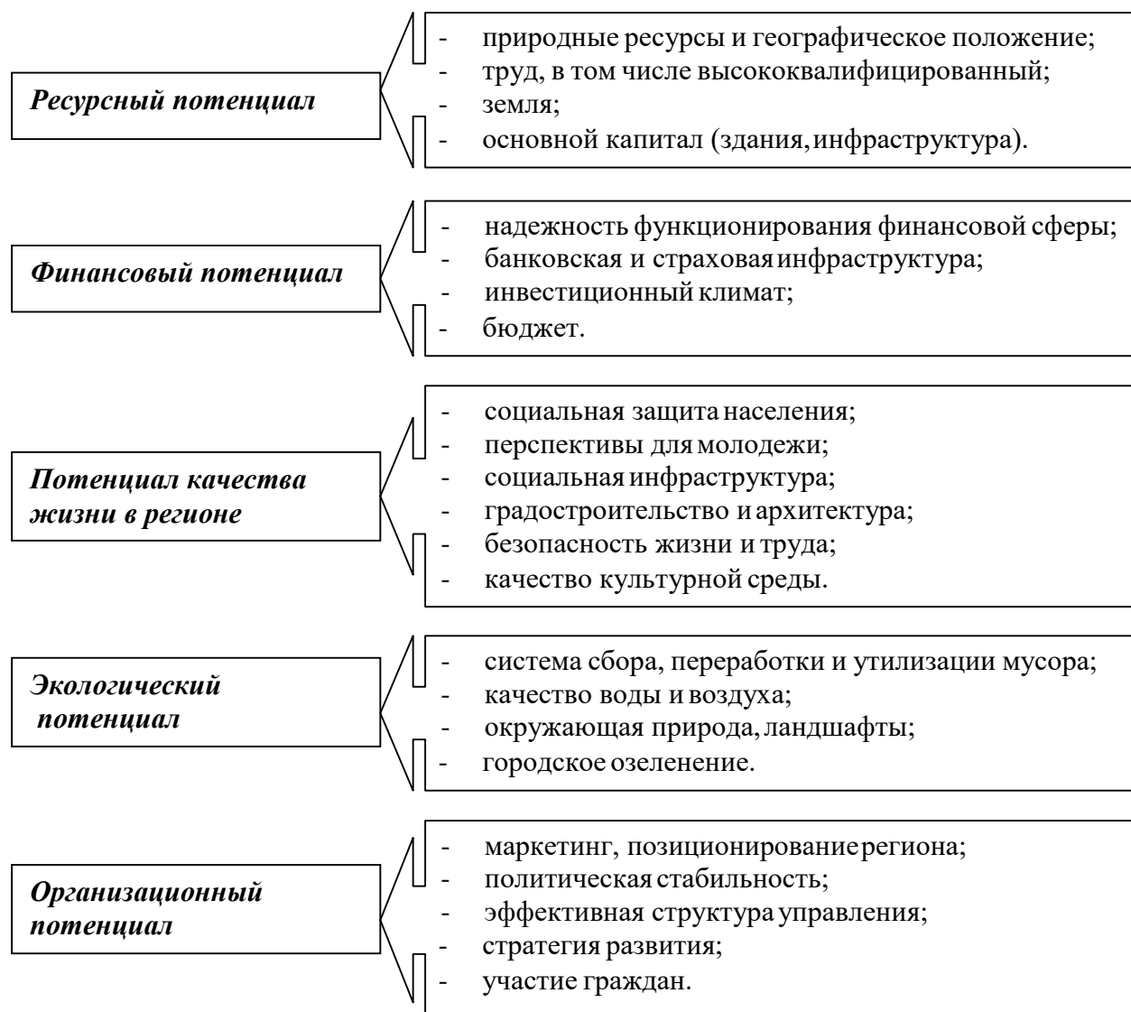
Рис. 1.1. Структура конкурентного преимущества регионального развития

шения уровня конкурентоспособности и социально-экономического развития региона [18, с. 41].