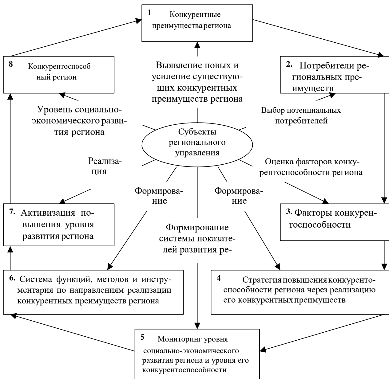
Рис. 1.3. Комплексный механизм реализации конкурентных преимуществ региона

На наш взгляд, для каждого предмета конкуренции (потребителя) существует набор факторов конкурентоспособности региона. Каждый такой фактор показывает наличие у территории определенных свойств, востребованных или особо ценимых потребителем при решении вопроса о поселении, размещении здесь производств, перемещении груза или посещении туристами данного места. Установленные требования и их весомость изменяются и во времени в зависимости от характера и особенностей потребителя. Этим