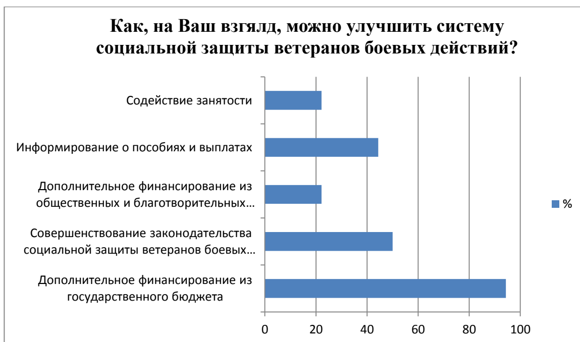
Рис.4. Диаграмма результатов ответа на вопрос №9

Таким образом, одной из приоритетных задач государства было и остается повышение качества жизни ветеранов боевых действий. Это является обязанностью государства с целью компенсации морально-психологических и физических издержек, которые понесли бывшие военнослужащие при выполнении своего долга по защите Родины и исполнении воинских обязанностей.