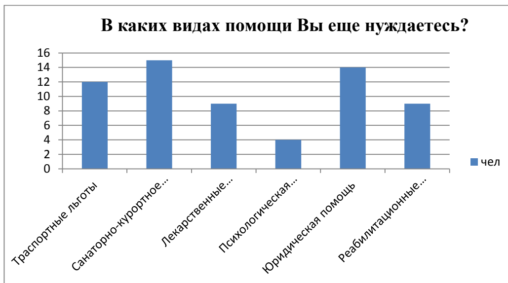
Рис.3. Диаграмма результатов ответов на вопрос №8

Отвечая на вопрос о нуждаемости в формах социальной поддержки, большинство ветеранов боевых действий отметили, что в большей мере нуждаются в санаторно-курортном лечении, это говорит о проблеме проведения своевременной реабилитации, адаптации. На втором месте оказалось получение бесплатной юридической помощи – это, может быть связано с тем, что они не обладают базовыми юридическими знаниями, которые могли бы получить в военных частях. На третьем месте было введение дополнительных транспортных льгот – во многих регионах отменили налог на транспортное средство и ввели бесплатный проезд на транспорте общего пользования, как по городу, так и пригороду, но в Республике Башкортостан пока таких преимуществ нет. Далее – лекарственные препараты и реабилитационные услуги и психологическая помощь (см. рис. 3).