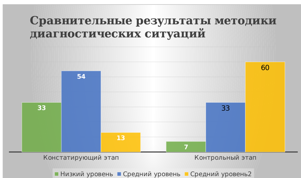
Рисунок 6. Сравнительные результаты методики диагностических ситуаций

По сравнительным результатам методик диагностических ситуаций, проведенных на контрольном этапе отчетливо заметно повышение уровня освоения приобщения детей к народной культуре, качественный прирост составил 47%. Дети заинтересовались народной игрушкой, при обследовании практически все дети называли и различали виды народных игрушек, знали материалы, из которых изготовлен тот или иной вид, называли местность происхождения народной игрушки.