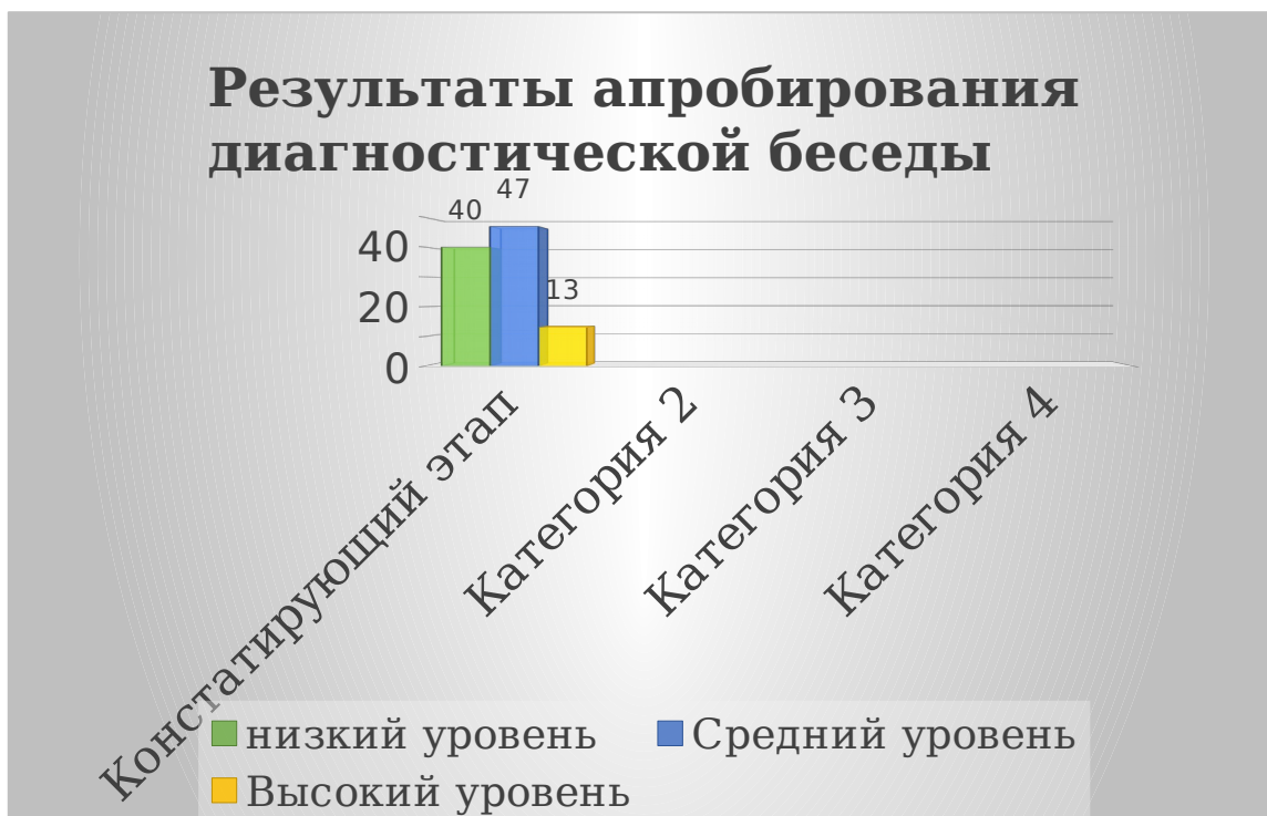
Рисунок 2. Результаты апробации диагностической беседы

В ходе диагностической беседы многие дети затруднялись ответить на некоторые поставленные вопросы. Сложным для ответа детей оказался первый вопрос, о том, что ценится в русских людях и почему данные черты характера, например - широта души наблюдается в основном у русских людей. Затруднил вопрос о старинных именах и рукоделиях родного края. Анализ результатов показал у 6 детей (40%) низкий уровень знаний старших дошкольников традиций родного края, знания русских богатырей, предметов народного быта, не имеют представление о народном костюме, традиционных праздниках. Дети не давали вопросов на поставленные ответы, даже при помощи наводящих вопросов.