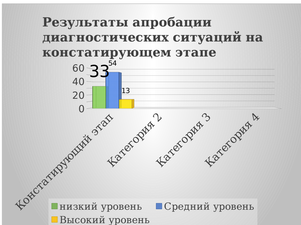
Рисунок 3. Результаты апробации диагностических ситуаций на констатирующем этапе

Полученные результаты говорят о том, что, даже, несмотря на то, что половина детей показала неплохие результаты, все равно есть небольшое количество дошкольников, которым необходима помощь в получении знаний о русской народной культуре, предметах прикладного творчества, знании народной игрушки, её значимости в жизни ребенка.