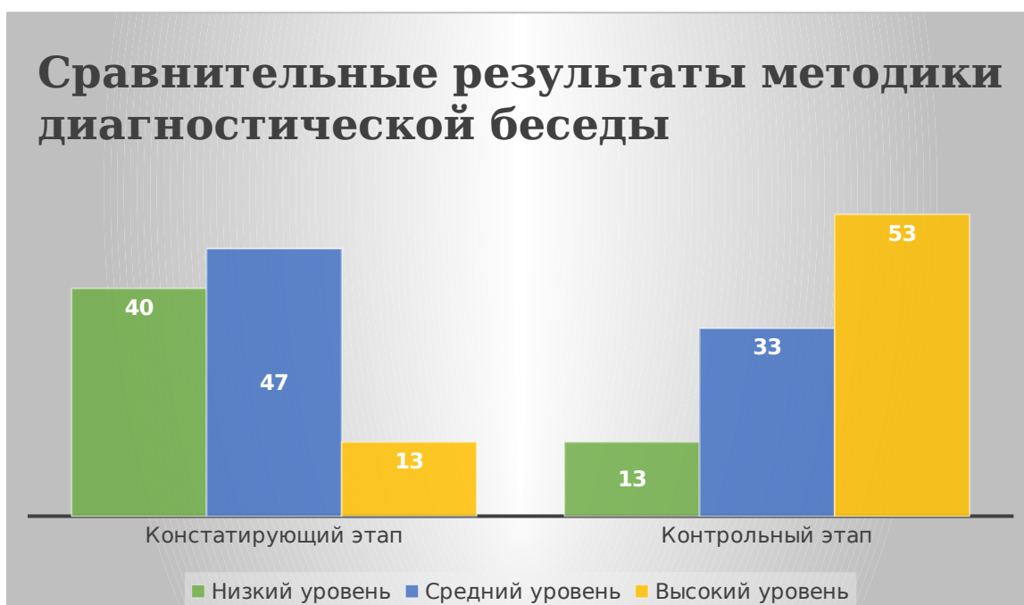
Рисунок 5. Сравнительные результаты методики диагностической беседы

По результатам контрольного исследования метода диагностической беседы видно, что у 8 детей уровень приобщения к народной культуре находится на высоком уровне (53 %), качественный прирост составляет 40 % (6 детей); 5 детей средний уровень (33 %), 2 ребенка с низким уровнем (13 %), улучшение уровня приобщения детей к народной культуре возросло на 27 %.