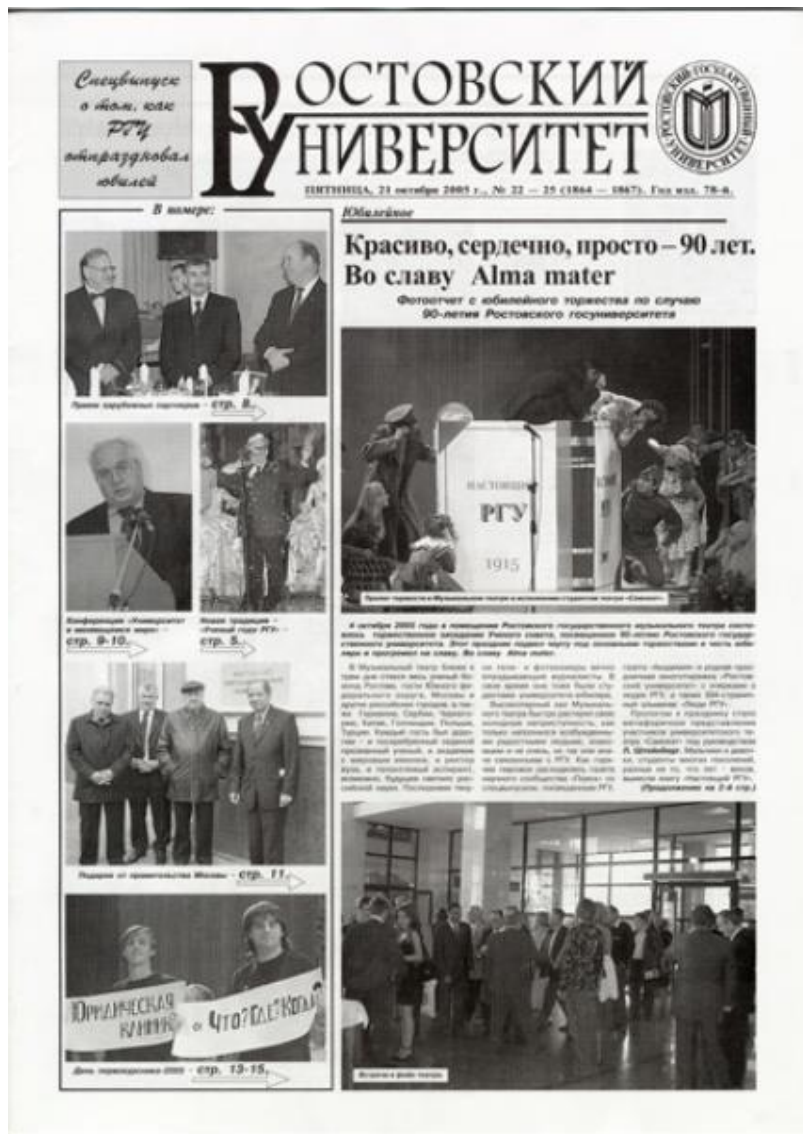
«Ростовский университет» №22-25 от 21 октября 2005 г.