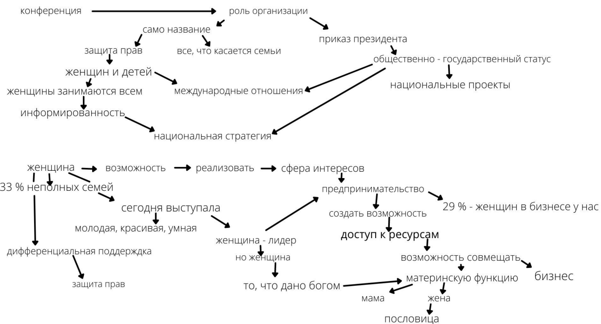
Приложение 2. Схема 2.