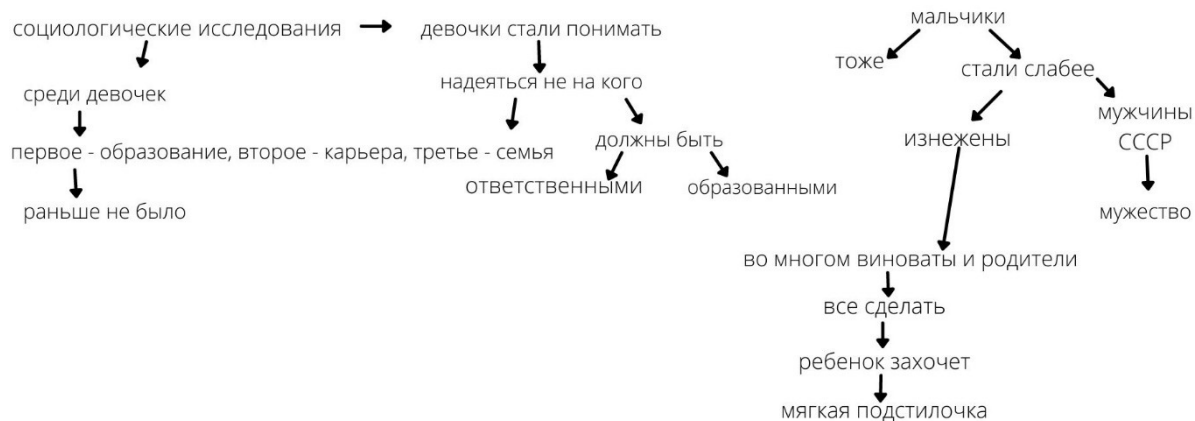
Приложение 4. Таблица 1.