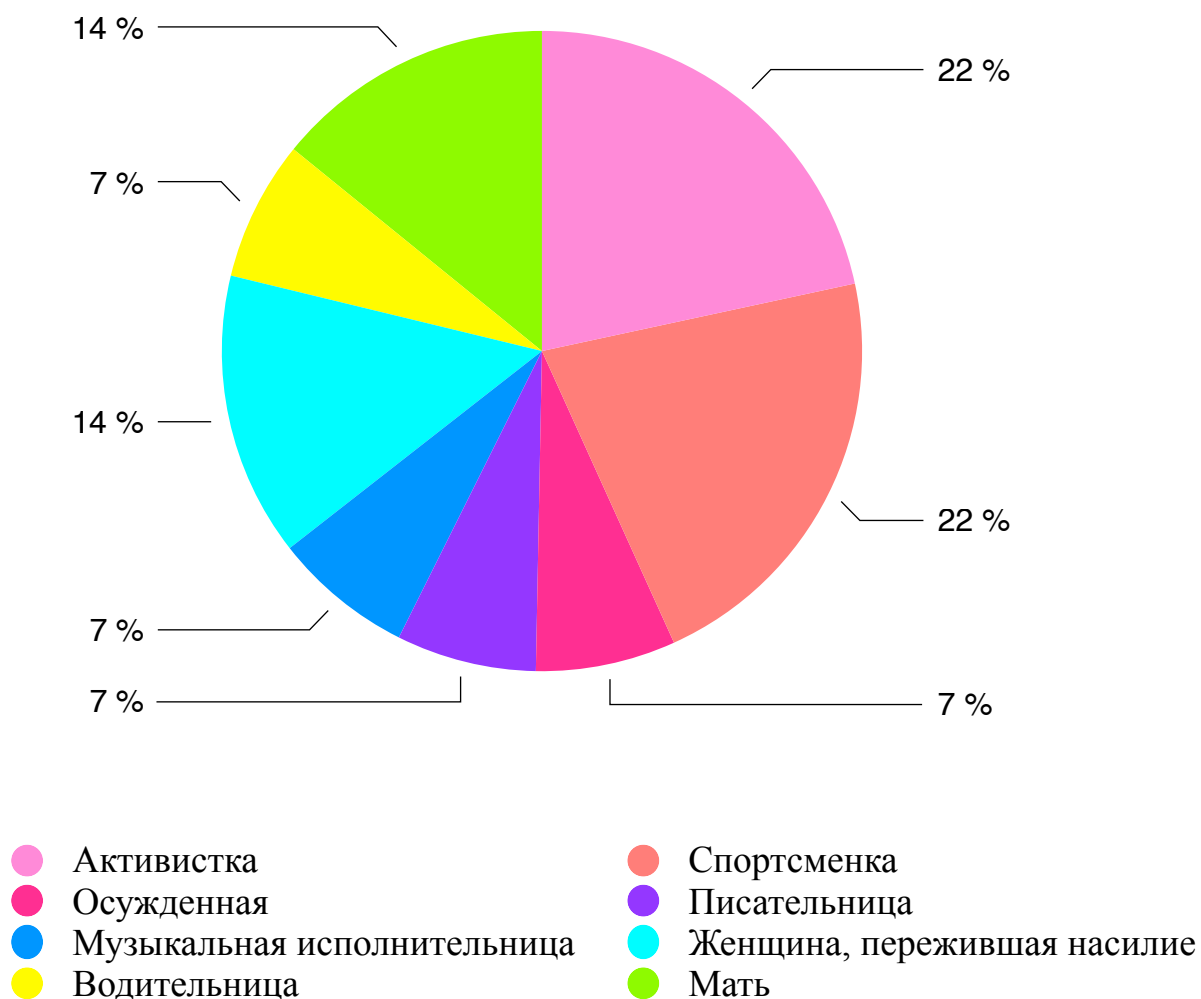
Диаграмма 1. Частые образы женщин в «Russia Today»