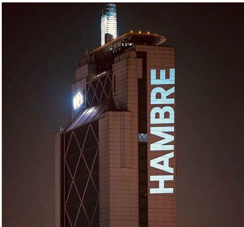
Рис. 1. «Голод» на телефонной башне в Сантьяго