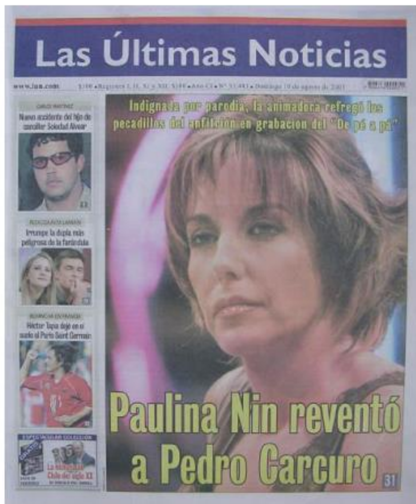
Иллюстрация 3. Портada de Las Últimas Noticias del 10 de agosto de 2003.