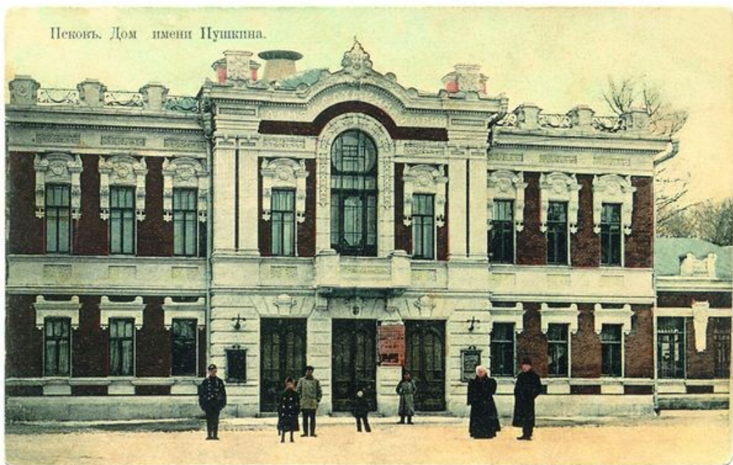
Коммунальный театр, впоследствии переименованный в Показательный и Малый театр, а в настоящее время – театр им. А. С. Пушкина