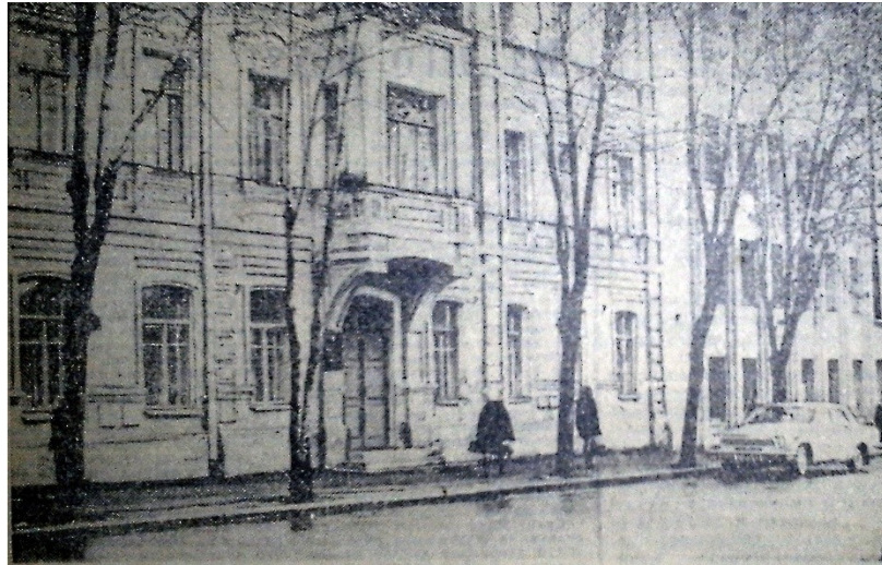
Псковский агитационный театр