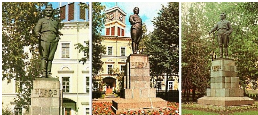
Памятник С. М. Кирову у Дома Советов