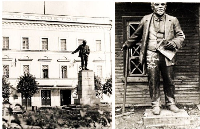
Памятник В. И. Ленину у Дома Советов