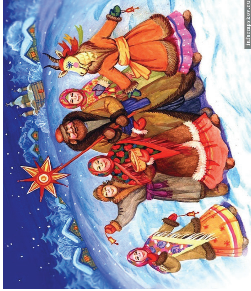
Фото предоставлено автором.