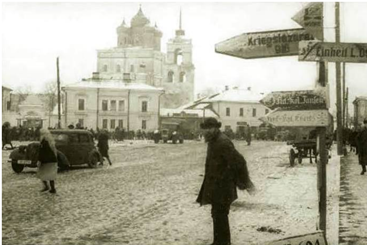
Псков в годы немецко-фашистской оккупации