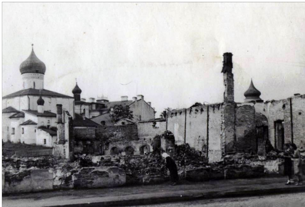
Разрушенный Псков. Фото 1944 – 1945 гг.

Фонды Государственного архива Псковской области хранят более 90 тысяч документов, свидетельствующих о злодеяниях фашистов. Осенью 1943 г. немецко-фашистское командование отдало приказ о массовом сожжении русских сел и деревень. В Псковском районе было уничтожено более 600 деревень. Фашисты расстреливали и заживо сжигали людей целыми семьями при малейшем подозрении в связи с партизанами. 5 декабря 1943 года в деревне Добровитки немецкий карательный отряд арестовал жителей и запер их в здании сельской церкви. Всех, кто пытался сбежать, расстреливали на месте. Затем храм Ильи Пророка был взорван, и все закрытые в нем люди погибли под его развалинами. В ноябре 1943 г. была дотла сожжена деревня Лихово. 22 октября 1943 г. гитлеровцы превратили в пепел деревню Ланева Гора. Были расстреляны и погибли в огне почти все жители деревни [iii]. Всего в Псковском районе на кануне войны насчитывалось 688 деревень из которых уцелело 190. Из 55700 жителей осталось 35 тысяч человек [iv].