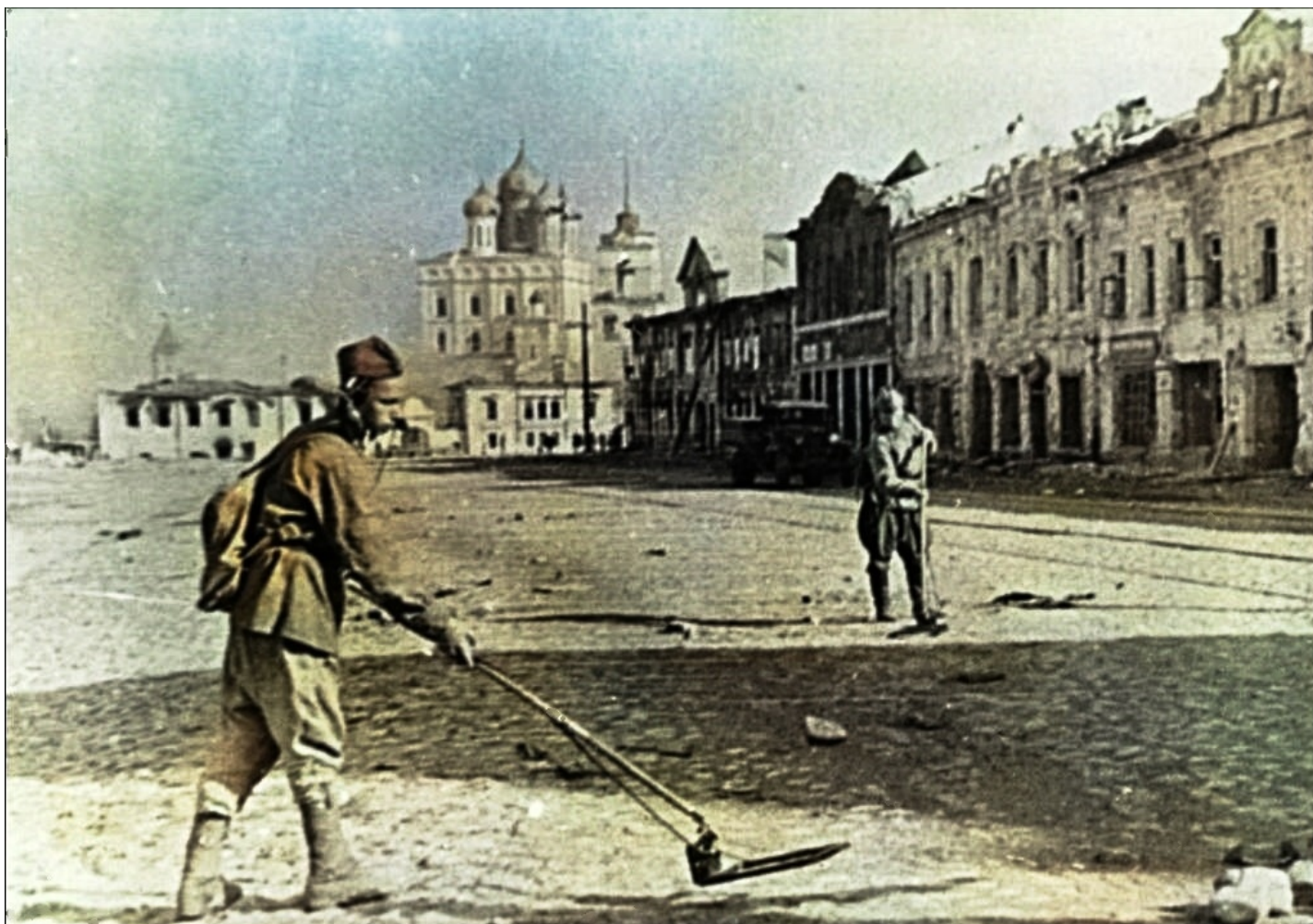
Разминирование Пскова. Фото 1944 г.