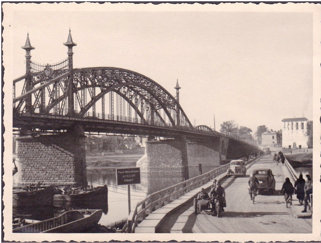
Псков в годы немецко-фашистской оккупации. Ольгинский мост.

Молодежь Пскова и Псковского района направлялась на торфяные разработки в Долгорепицы. Люди работали под угрозой расстрела. Рабочий день длился по 14 – 16 часов. В 1943 г. на Ваулиных высотах были организованы гравийные разработки на которых было занято около 500 человек, в основном молодежь, мобилизованная из района. В те годы карьер на Ваулиных горах называли «Ваулинской каторгой». «Гражданские» лагеря были созданы в Черехе и Промежицах. От изнурительного труда и голода, от эпидемических заболеваний и избиений в трудовых лагерях гибли сотни людей[1].