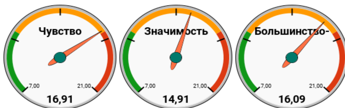
Рис. 3. Средний балл каждого из показателей в группе представителей других национальностей