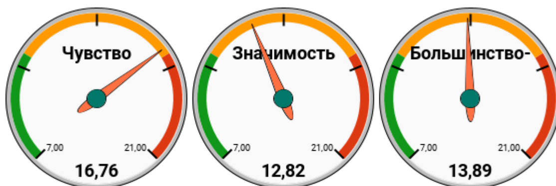
Рис. 2. Средний балл каждого из показателей в группе людей, относящих себя к русским