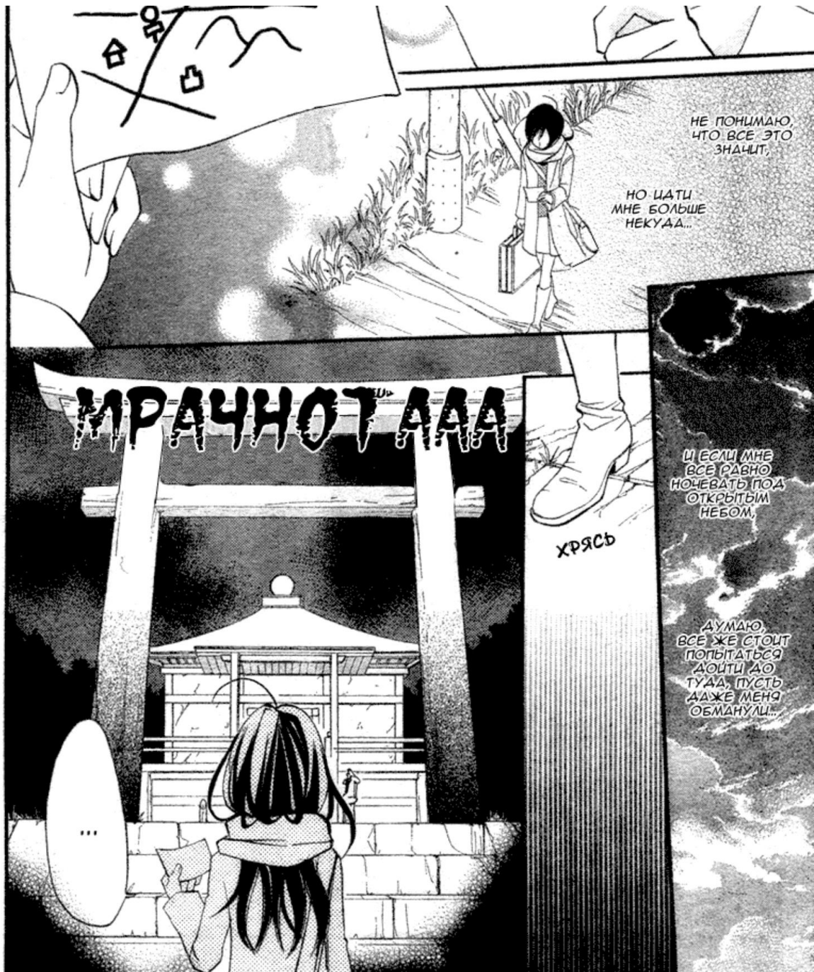
Храм в манге «Очень приятно, Бог»