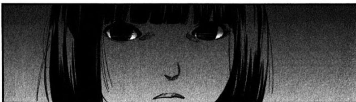
Юрэй в манге «Бездомный бог»