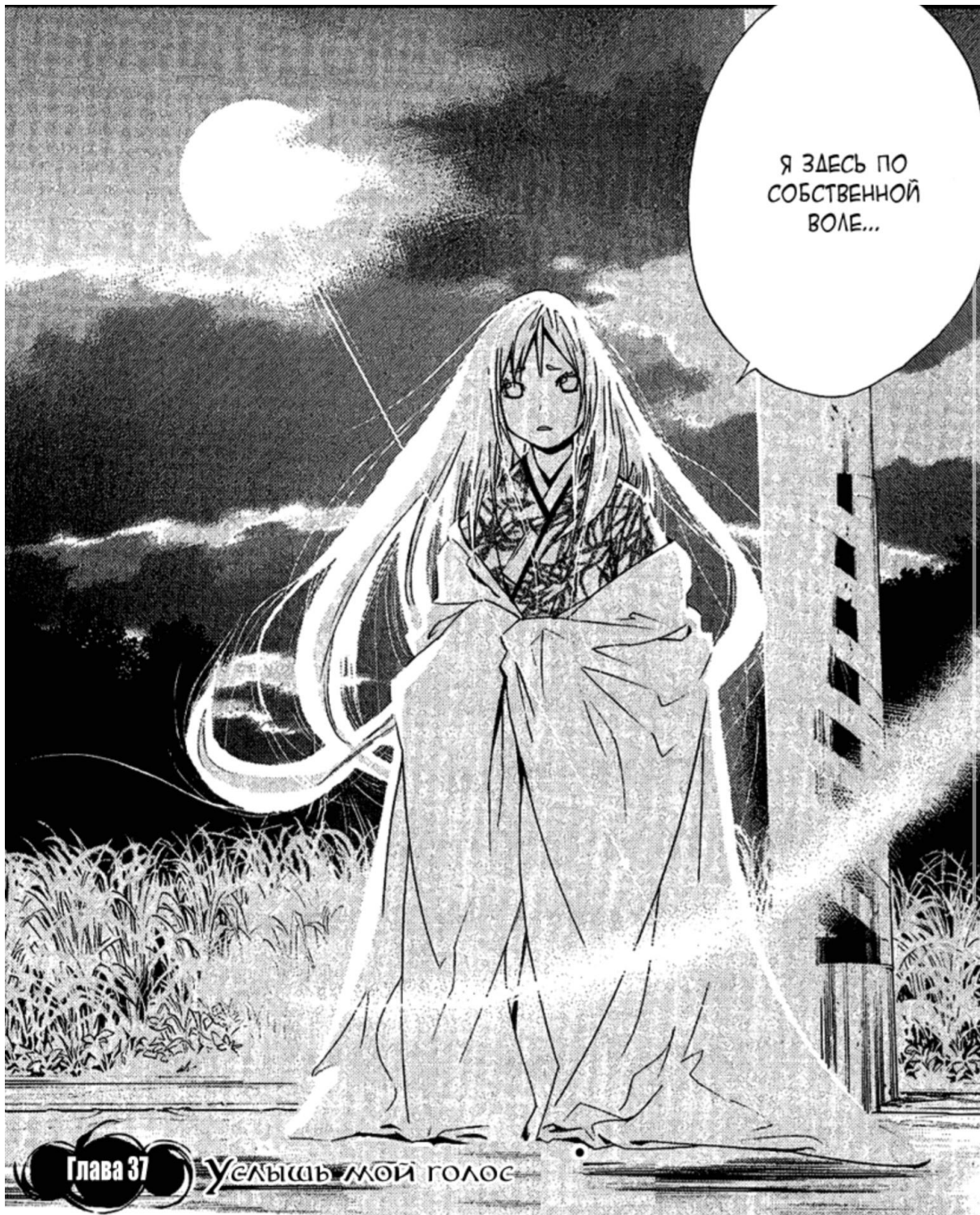
Аматэрасу в манге «Бездомный бог»