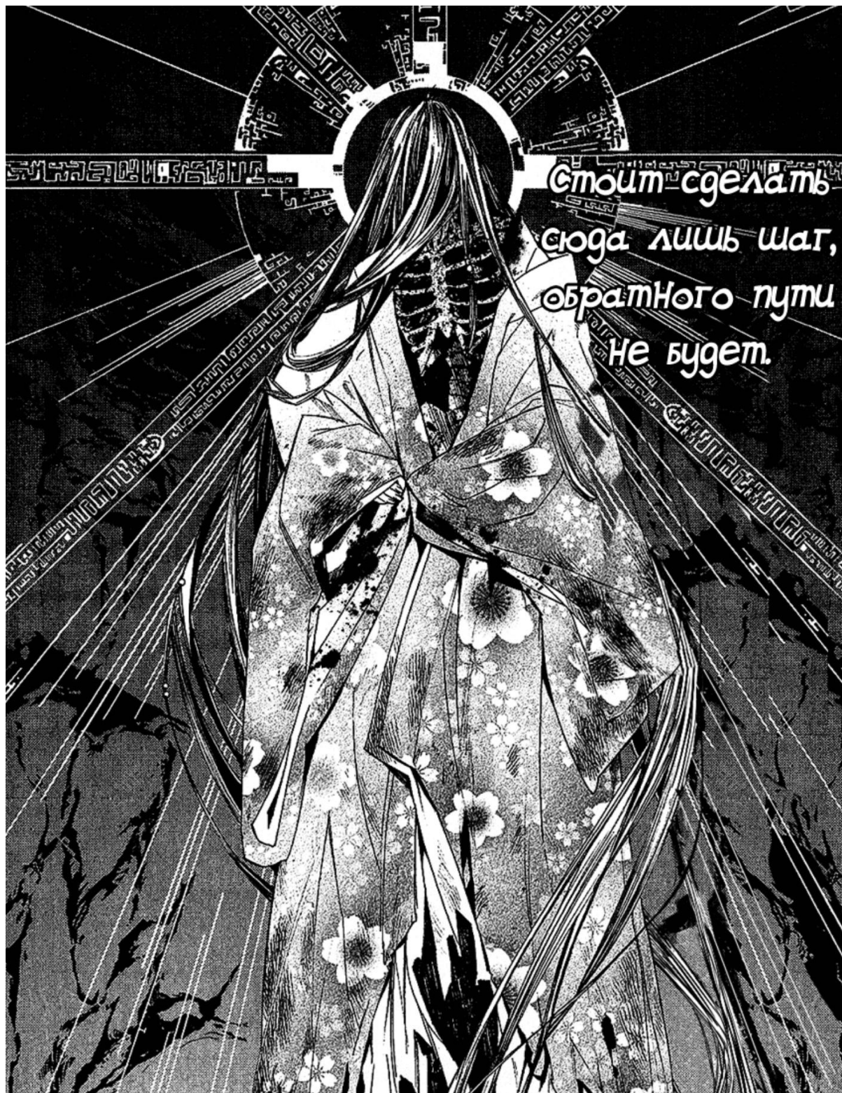
Идзанами в манге «Бездомный бог»

Миф о синигами, или богах смерти, появился в Японии позднее, чем миф об Идзанами, и возможно пришел из китайской мифологии. В