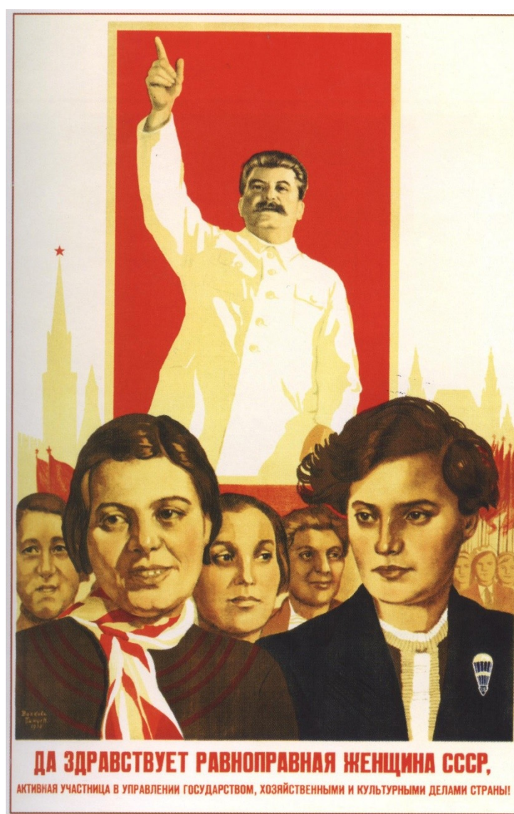
Рис. 6. «Да здравствует равноправная женщина СССР...» (М. Волкова, Н. Пинус, 1938)

В. Сталин в 1936 году подарил советским женщинам Конституцию, в которой законодательно закрепил равноправие и расширил привилегии для беременных и матерей. В публицистике Крупской это событие отражается как окончательное достижение равноправия, личная заслуга Сталина. Поэтому фигура вождя – это фигура и освободителя, и отца-покровителя женщин. Прослеживается мысль, что при Сталине – наиболее комфортные условия для женщин (хотя мы уже знаем, что это не так).