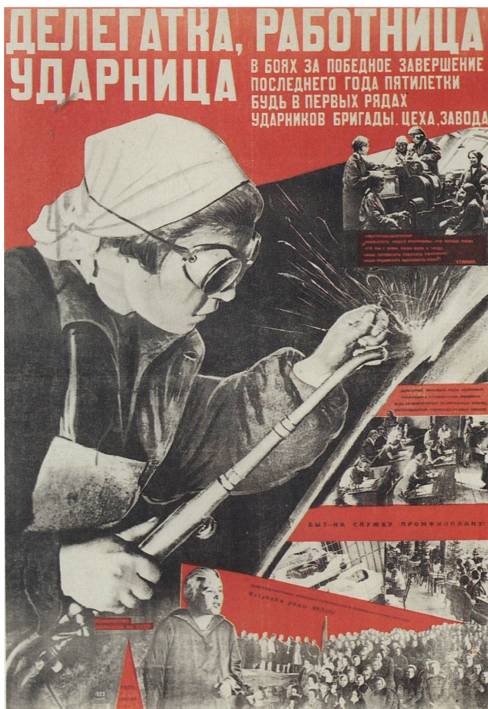
Рис. 2. «Крестьянка, коллективизируй деревню. Иди в ряды красных трактористок!» (Неизвестный автор, 1930 г.)

Поэтому колхозница на тракторе становится одним из ключевых образов плакатов 30-х.