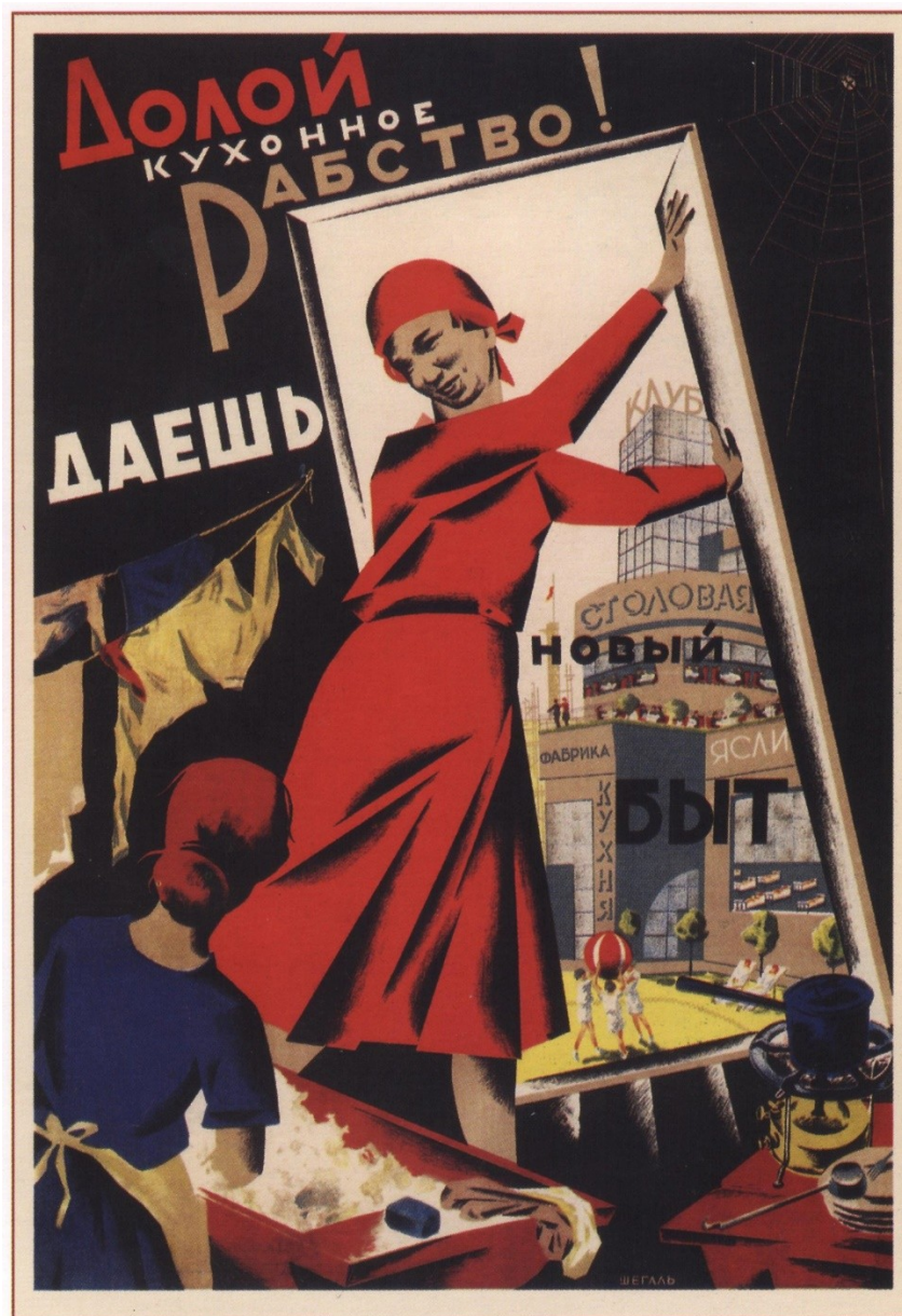
Рис. 5. «Долой кухонное рабство! Даешь новый быт» (Г. М. Шегаль, 1931)

перерастет в сферу социального обслуживания граждан: общественные столовые, ясли, фабрика, кухня – это заботы не женщины, а государства. Революционерка в символической красной одежде буквально открывает окно в новый лучший мир – из тьмы в свет.