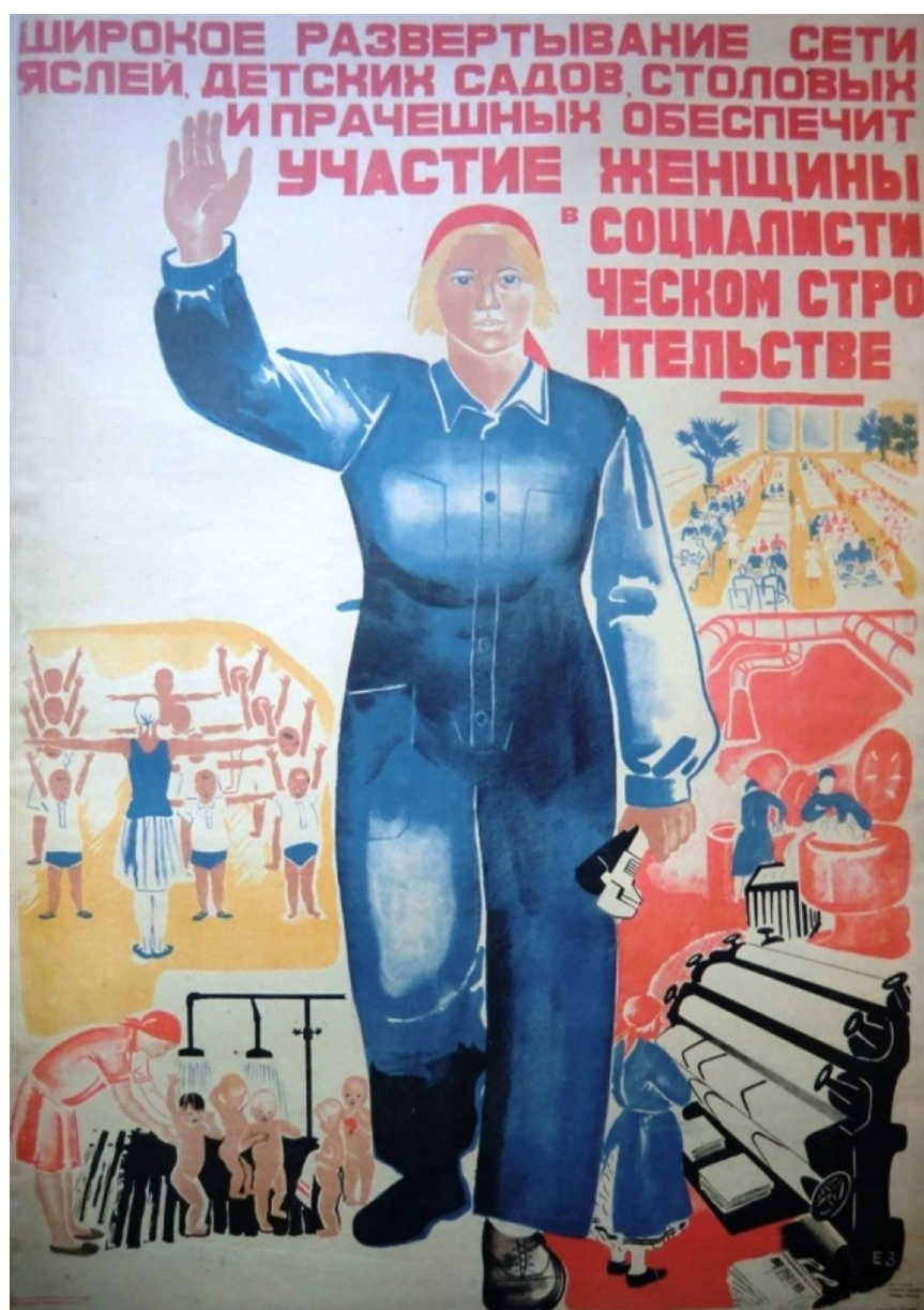
Рис. 4. «Широкое развертывание сети яслей, детских садов, столовых и прачечных обеспечит участие женщины в социалистическом строительстве!» (Е. С. Зернова, 1931)