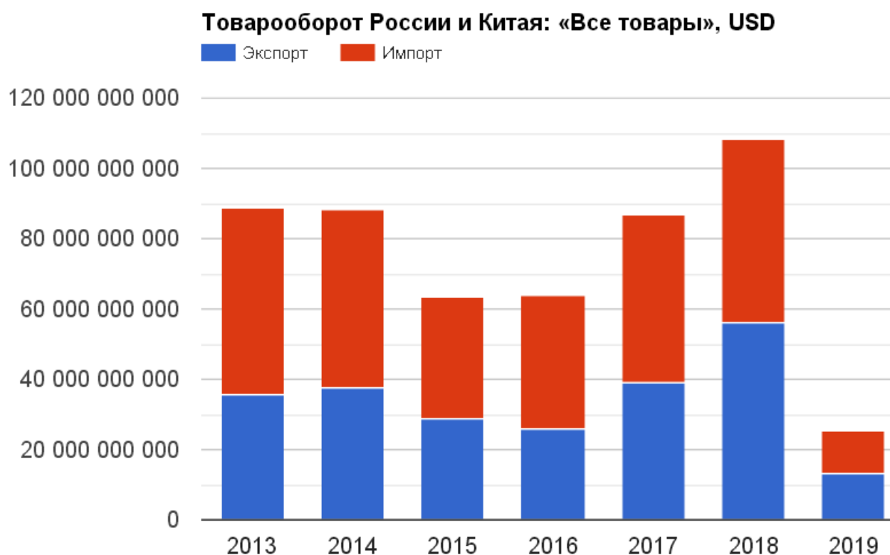
Рисунок 1.3 – Динамика товарооборота России и Китая в 2013-2019 гг., дол. США 28

Однако, в 1992-2011 гг. положительное сальдо для России в торговле с КНР не достигало выше 26 млрд. долл. В случае если говорить более подробно, то на 2003 г.. объем товарооборота между государствами был на уровне 15700 млн. долл., положительное сальдо для РФ составило 3700 млн. долл., а китайские инвестиции в российскую экономику не превышали 300 млн. долл., уступая японским. 29 Для сравнения, торговый оборот Китая и США в 2018 равнялся 558 млрд. долл., Китая и ЕС - 564 млрд. долл., а Китая и